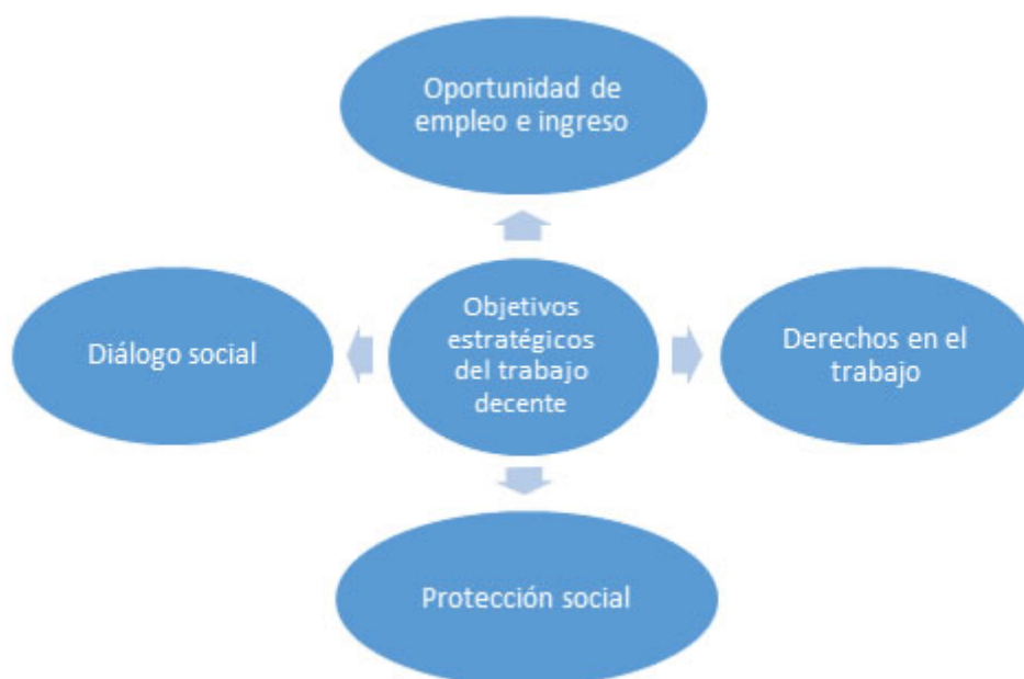
Figura 2 Objetivos estratégicos del trabajo decente Elaboración propia

Oportunidad de empleo e ingreso: debe tenerse presente que, para lograr un trabajo decente, es esencial o fundamental que primero se cuente con uno. Es esencial tener presente que tanto las oportunidades laborales como la remuneración podrían variar según las políticas estatales de cada nación, al igual que su nivel de desarrollo, y por tanto, es preciso que en la denominación de empleo se tenga en consideración las variadas modalidades de contratación que pueden existir, ya sean que ellas sean formales, informales o autoempleo; es por lo anterior que debe tenerse claro que “el trabajo decente supone la existencia de oportunidades de empleo para todos. En ese caso, hay que evaluar en qué medida la población de un país se encuentra empleada” (Centro de Investigaciones Socio-Jurídicas CIJUS, 2008, pág. 8).