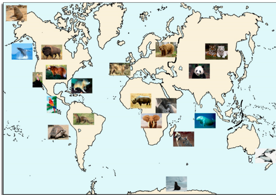
Figura 1.- Mapa de especies en peligro de extinción