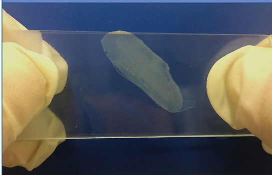
Figura 1. Detalle de proglótide de Taenia saginata extraído de las heces de la paciente entre portas sin tinción