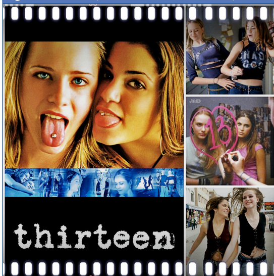
Figura 3. Thirteen (Catherine Hardwicke, 2003)