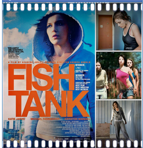
Figura 7. Fish Tank (Andrea Arnold, 2009)