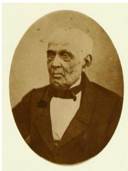
IMAGEN 1. VALENTÍN GÓMEZ FARÍAS, ANCIANO