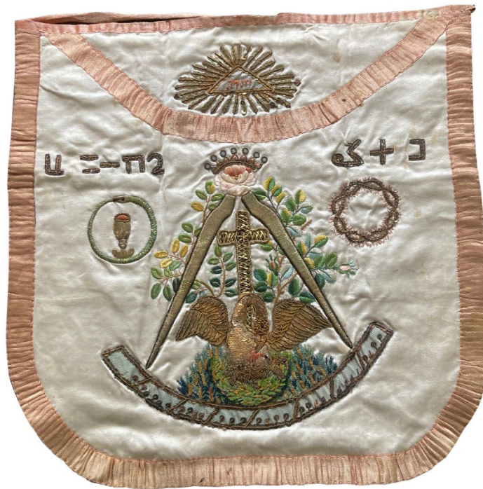
Figura 4: Mandil de Caballero Rosacruz estilo Luis XVI. Bordado sobre seda. Finales del siglo XVIII o inicios del XIX. Colección particular.

De entre las figuras aquí mencionadas, vamos a detenernos a continuación en aquellas que responden a un doble requisito: ser con frecuencia adoptadas en el ritual, mobiliario e indumentaria rosacruces, y guardar un significado manifiestamente vinculado, al menos en origen, a la vida de Cristo y la narrativa evangélica.