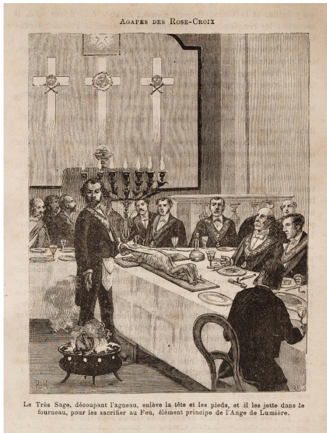
Figura 6: Pierre Méjanel (diseño) y Adolphe-François Pannemaker (grabado), “Ágape de los Rosacruces”. Xilografía. Léo Taxil, Les Mystères de la Franc-Maçonnerie dévoilés (París: 1886), grabado 40.

entre otros símbolos del grado 129 [Fig. 6]. La función principal del banquete reside en convocar un sentido profundo, de naturaleza eminentemente espiritual, que insiste en el mensaje de redención y resurrección que caracteriza todo el ritual de iniciación del grado 130 .