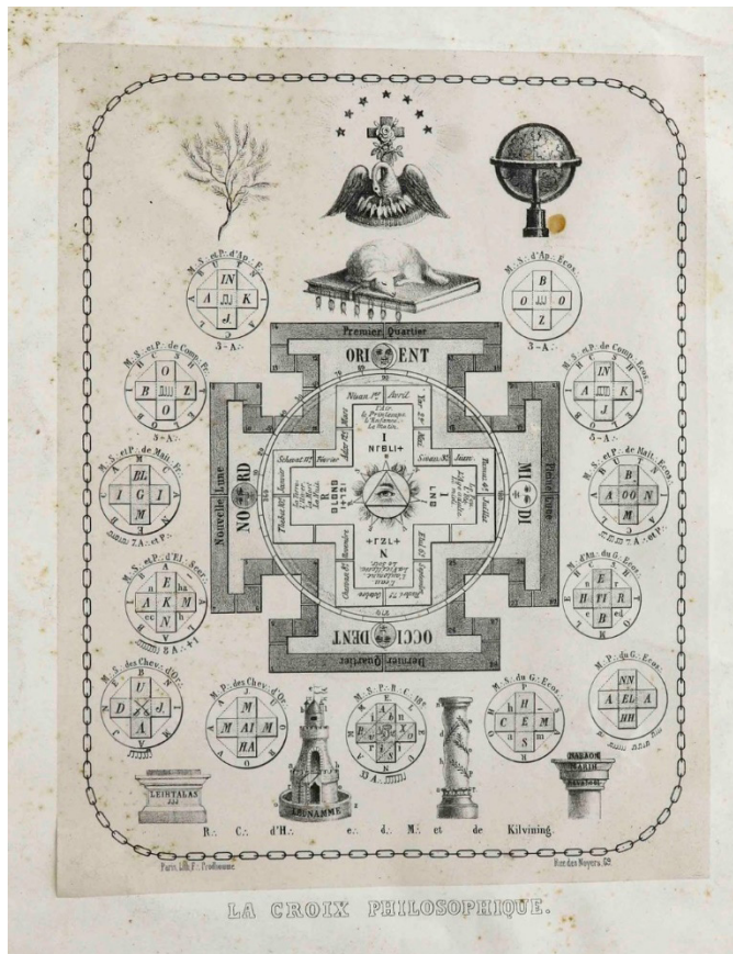
Figura 5: Cruz filosófica con diversos símbolos del grado rosacruz. Grabado litográfico. Siglo XIX.

vido objeto de estudio en los grados precedentes: ofrece una explicación simbólica de la escala de los siete grados, que recuerdan los elementos simbólicos y filosóficos esenciales, fijados en la época por el Régulateur du Maçon y por el Régulateur des Chevaliers Maçons 80 .