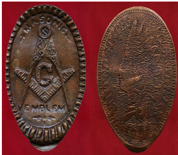
Penny elongado de 1904 con símbolos masónicos.

Otra costumbre muy extendida en los EE. UU. es la de elongar —alargando por tracción mecánica— los centavos a la vez que se estampa un motivo que se encuentra grabado en uno de los dos cilindros de la prensa laminadora por la que pasa la moneda. De la misma manera que en el caso anterior, este procedimiento se realiza con fines publicitarios, conmemorativos —su uso se popularizó con motivo de la celebración de la Exposición Universal de San Luis de 1904—, o identitarios, como es el caso de los masónicos. De estos últimos, se pueden encontrar numerosos ejemplos en los que aparecen estampados diferentes símbolos relacionados con logias o cuerpos masónicos como los Shriners o el símbolo de la masónica Orden de la Estrella de Oriente.