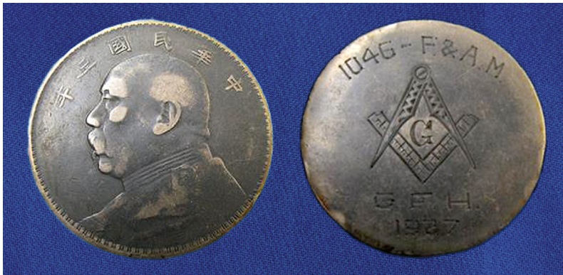
Dólar (Yuan) chino usado por la logia Queens Village n o . 1046 en 1927.

En el siguiente ejemplo podemos observar una curiosidad, toda vez que se trata de la reutilización de una moneda de China del periodo republicano por una logia estadounidense 8 . Podemos observar cómo se ha suprimido completamente la acuñación del reverso para incorporarle una leyenda y simbología masónica que hace referencia a una logia y, presumiblemente, a su destinatario por las iniciales grabadas.