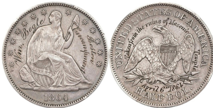
Medio dólar norteamericano de plata de 1864 con leyendas grabadas a mano sobre anverso y reverso sin alterar la acuñación.

Por último, hemos creído oportuno añadir el ejemplo de una moneda de curso legal a la que se le ha incorporado una leyenda sin modificar el modelo original. Esta moneda se acuñó para recaudar fondos destinados a la reedificación del templo masónico de Boston, MA, conocido como “Casa Winthrop”, que fue pasto de las llamas durante un incendio ocurrido en la noche del 04 de abril de 1864 9 .