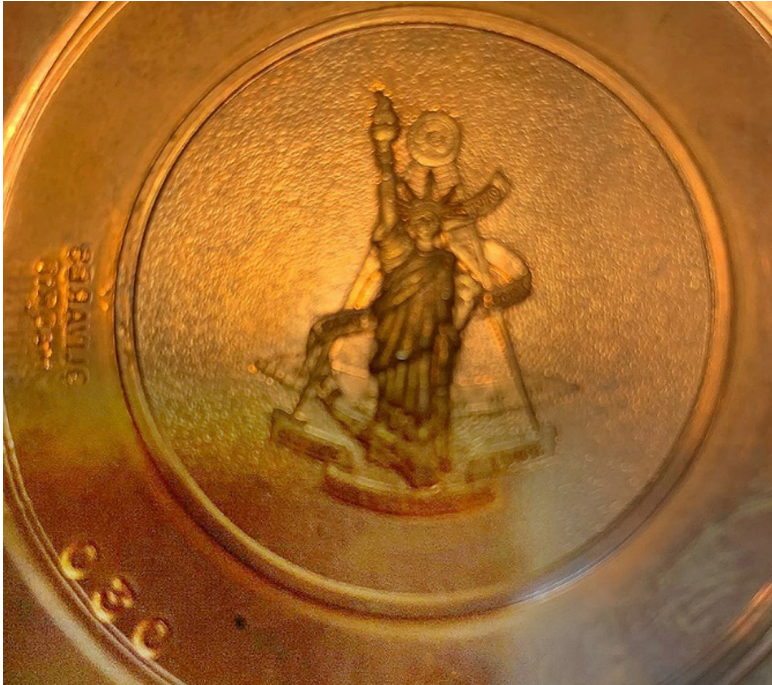
Prueba de estampación del troquel de la logia Liberty n.º 70. A la izquierda se observa invertido el punzón del grabador.

realizado en la madrileña casa de grabadores de Antonio Olivares que tuvo el establecimiento en la calle Concepción Jerónima n.º 8. Este grabador, junto a José Rokiski, y Augusto Delbreil, además de las fábricas de medallas Casa Feu y Arnillas y Matallana —todas empresas hoy desaparecidas— estuvieron en activo durante la época dorada de la medallística madrileña desde finales del siglo XIX hasta entrado el último tercio del siglo XX.