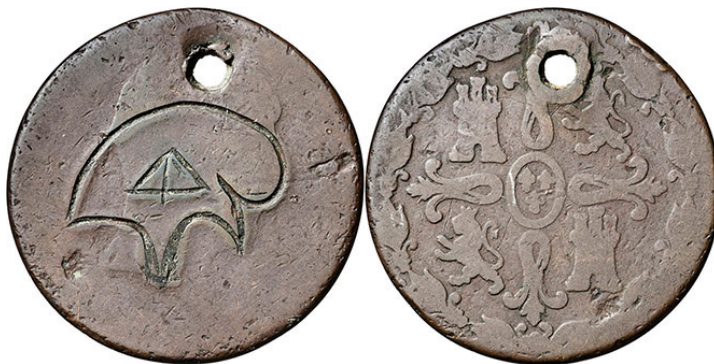
Grabado sobre 8 maravedís de Fernando VII

Finalmente, la reutilización de moneda es un procedimiento de bajo coste cuando se desea o se necesita disponer de este tipo de artefactos, para uso interno o propagandístico, siendo suficiente con eliminar parte de la iconografía original para añadir —ya sea por estampación, grabado u otra técnica— los emblemas o mensajes de naturaleza masónicos.