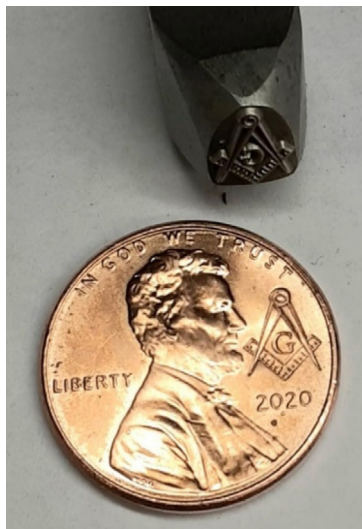
Penny masónico EE. UU. y punzón.

Los resellos masónicos más abundantes los encontramos en las monedas de un centavo de dólar de los EE. UU. comúnmente llamados penny , la moneda de menor valor y que en el pasado era acuñada en cobre. El símbolo más habitual es la escuadra y el compás, pero también encontramos otros como el jeroglífico formado por dos bolas y un bastón cuya pronunciación recuerda al personaje bíblico Tubalcaín: Two ball cane , una paleta de albañil o el águila bicéfala del Rito Escocés Antiguo y Aceptado, etc. Los punzones pueden adquirirse fácilmente en internet y, como señalamos anteriormente, este tipo de resellos los puede efectuar uno mismo. Los centavos masónicos no tienen otro significado más que el de pertenencia a la orden, un carácter identitario.