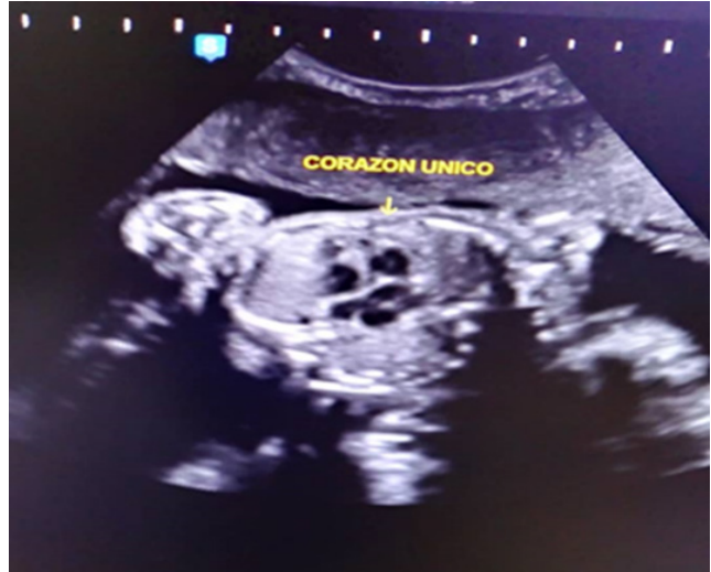
Figura 2. Corte axial de tórax: visible un solo corazón.