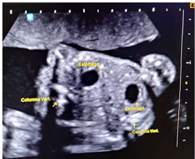
Figura 4. Corte axial de abdomen fetal fusionado: se observa 2 estómagos y 2 columnas vertebrales (ver flechas).