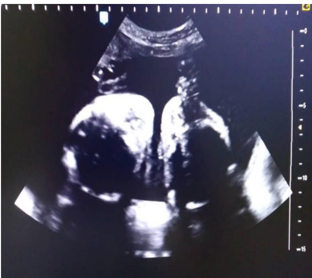
Figura 1. Se aprecian 2 polos cefálicos separados, visibles en el mismo plano de corte.

Se trata de paciente femenina de 19 años, sin antecedentes familiares, personales y patológicos conocidos, IV gestas, II cesáreas, I aborto, FUR 18/08/2018, quien acude a especialista en medicina materno-fetal y en vista de hallazgos ecográficos es referida a la Unidad de Perinatología y Medicina Materno-Fetal del Hospital Materno Infantil Dr. José María Vargas, siendo evaluada el 13 de febrero de 2019, donde se realiza estudio ultrasonográfico Perinatal en tiempo real, con transductor convex de 3,5 mHz, ecógrafo marca Esaote, visualizándose estructuras fetales compatibles con dos fetos que correspondían a un embarazo múltiple doble, se identificaron ambos polos cefálicos ubicados en el mismo plano de corte durante la exploración (Figura 1), 4 extremidades superiores, tórax y abdomen de ambos fetos fusionados, corazón único (Figura 2), de difícil evaluación, impresionando defecto septal ventricular de 4,6 mm (Figura 3), 2 cámaras gástricas (Figura 4), 2 vejigas, sexo femenino, 4 extremidades inferiores, una sola placenta anterior, grado I, grosor 42 mm, con índice de líquido amniótico (ILA) máximo bolsillo vertical (MBV) de 43 mm. Concluyéndose estudio ecográfico con diagnósticos de: Embarazo múltiple doble monocorial monoamniótico (Duplicata completa: siameses toracoconfalopago) de 25 semanas más 4 días por fecha de última menstruación con corazón único asociado a posible comunicación interventricular (CIV) sub-aortica.