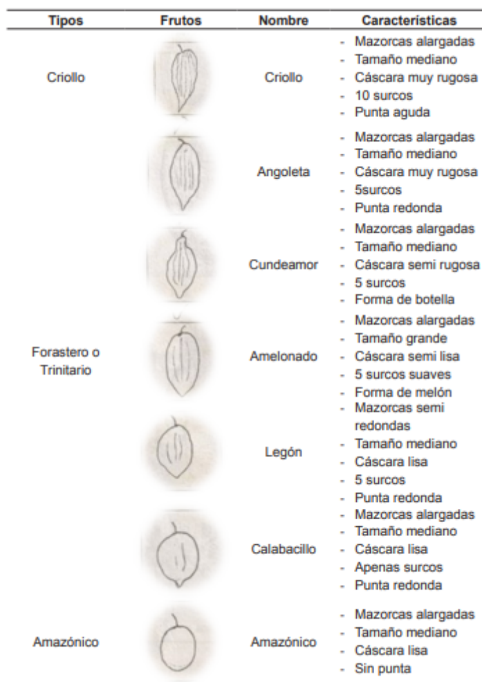
Cuadro 3 Características morfológicas del fruto de cacao

Características Químicas En el siguiente cuadro 4 están reportados los valores promedio de la composición química proximal para las harinas