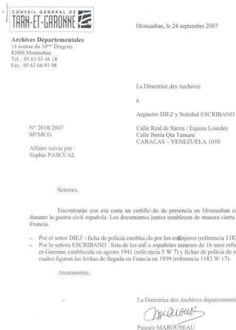
Figura 6 Certificado de presencia expedido por la Dirección de Archivos de Montauban, Francia como refugiados durante la guerra civil española.

Muchos años después, ya viviendo en Venezuela, y por motivo de solicitar sus documentos para fines de la memoria histórica, le fue entregada por las autoridades francesas la siguiente comunicación: