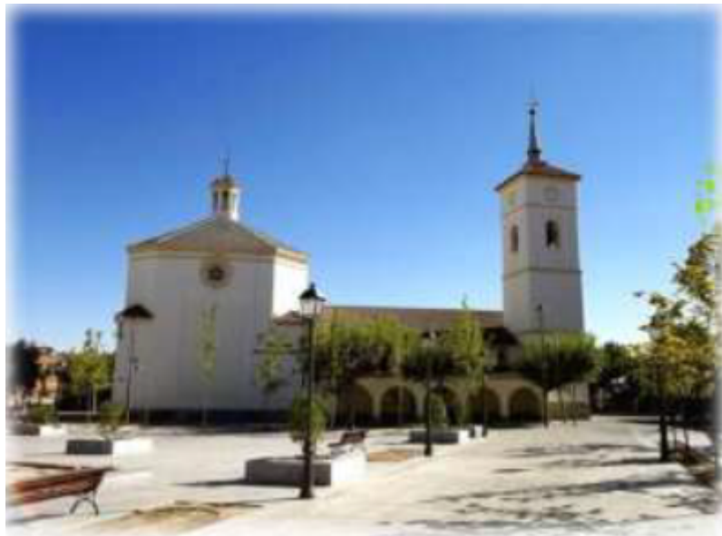
Figura 3 Iglesia de Santa Catalina de Majadahonda, Madrid.

“Mi traje llevaba como una cruz blanca en el pecho y la falda terminaban con un borde bellissimo plisado”. Y mis zapatos estaban forrados de raso blanco”.