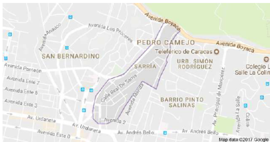
Figura 13 Ubicación de Sarria

Posteriormente, para el año 1950, Soledad y su familia se radicaron en Sarria, populoso sector de la ciudad de Caracas, ubicado en la zona centro norte de la capital, cuyos límites actualmente son: la Avenida Andrés Bello por el sur, la Cota mil y Pedro Camejo al norte, La Quebrada Caroata y Simón Rodríguez al este y San Bernardino al Oeste. (Ver figura 13).