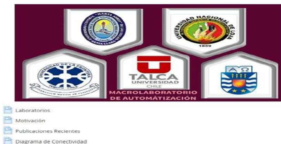
Figura 1 Pantalla principal del Macrolaboratorio

A continuación, la figura 1, muestra el logotipo de la pantalla principal del Macrolaboratorio.