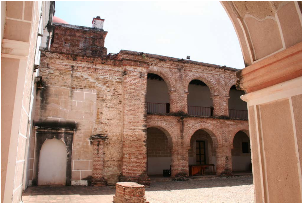
Figura 1. Templo y antiguo convento dominico del siglo XVI en Chiapa de Corzo, Chiapas.