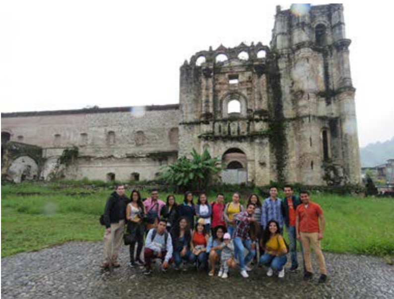
Alumnos de 8º semestre en el antiguo convento del siglo XVI de Tecpatán, Chiapas.