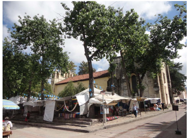
Figura 4. Conservación del patrimonio edificado a través de la recuperación del espacio público. Caso de estudio: Conjunto arquitectónico de Santo Domingo en el Centro Histórico de San Cristóbal de Las Casas, Chiapas. Tesis de Maestría.

En enero de 2005 se dio inicio formal al Programa de Posgrado en Arquitectura y Urbanismo propio de la UNACH. Los resultados de tesis de grado en el área de Historia y Conservación han sido variadas y con sentido de atender las necesidades de la comunidad donde se ubica el proyecto desarrollado, todas ubicadas en el Estado de Chiapas (Tabla 4) (Figura 4).