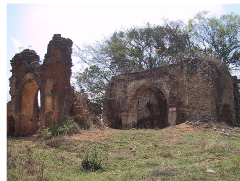
Figura 3. Rescate de la capilla dominica de San Lucas, municipio de Villaflores, Chiapas. Tesina de Especialidad. Foto: autor, 2002.