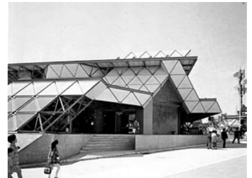
Figura 15. Pabellón de Cuba en la Expo Internacional Osaka '70, proyecto de un equipo de docentes y estudiantes dirigido por el profesor Emilio Escobar elaborado en 1969-70. Fuente: [16 p.138]