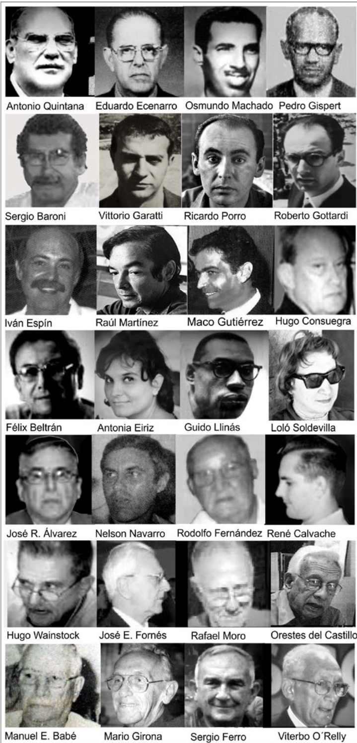
Figura 5. Parte de los docentes de la Escuela de Arquitectura de La Habana de los '60. En las filas inferiores se presentan fotos más recientes de algunos de los profesores.

[25] García AH. Los cinco edificios más emblemáticos en el Vedado de Antonio Quintana Simonetti. Diario del Sureste [Internet]. 2019 mayo 17 [consultado 14 de junio 2019]. Disponible en: https://www.diariodelsureste.com.mx/los-cinco-edificios-mas-emblematicos-en-el-vedado-de-antonio-quintana-simonetti/ .