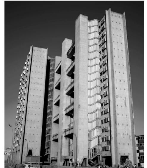
Figura 6. Edificio en Malecón y F, diseñado por los Arquitectos Antonio Quintana y Alberto Rodríguez y construido en 1965.