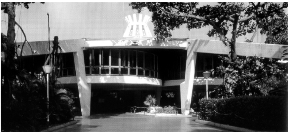
Figura 7. Heladería Coppelia, proyecto del arquitecto Mario Girona, construida en 23 y L en el Vedado.