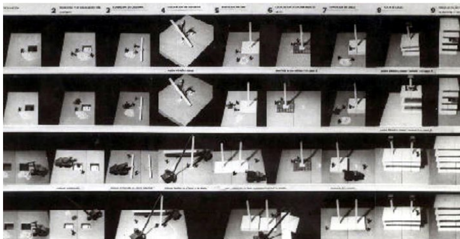
Figura 13. Proyecto de estudiantes cubanos, ganador del Premio Atenas en el Concurso del Encuentro Internacional de Estudiantes de la UIA '69, Buenos Aires. Estudio del proceso constructivo.