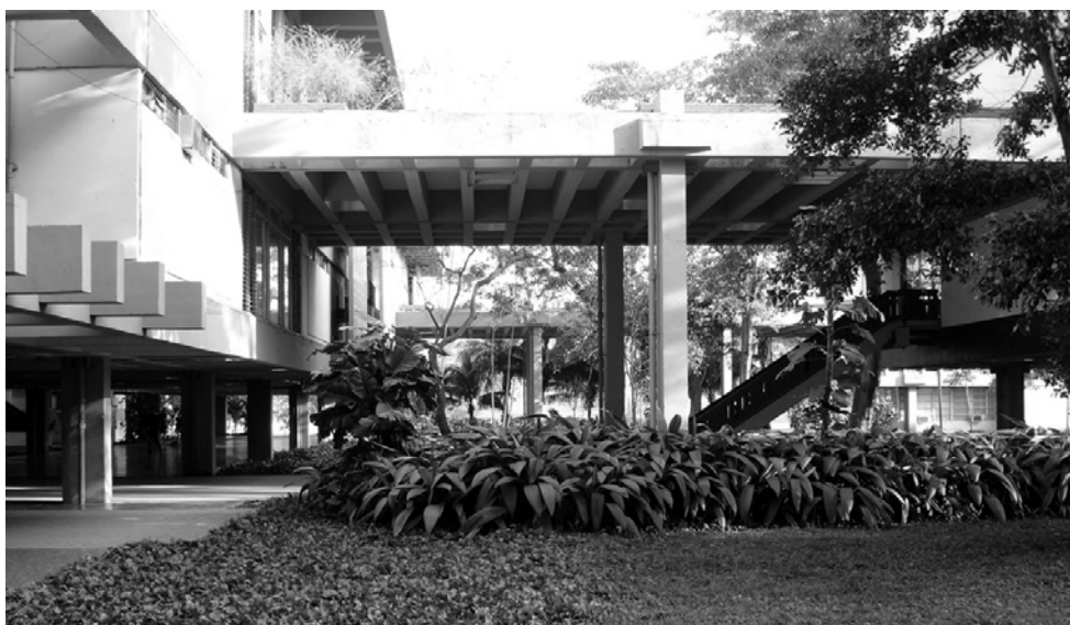
Figura 10. Ciudad Universitaria José Antonio Echeverría, CUJAE (1964), nueva sede de la entonces Facultad de Tecnología de la Universidad de La Habana. La escalera a la derecha conduce al edificio que ocupó provisionalmente la Escuela de Arquitectura durante el curso 1964-65.

Con frecuencia las obras se identificaban con un autor específico, generalmente atribuidas al proyectista general o principal, aunque realmente los resultados correspondieran a un colectivo, al cual se sumaba el talento creativo de cada uno de los participantes durante el proceso proyectual. Llama la atención que los proyectos que fueron iniciados o concebidos en la etapa final de los '60 (algunos de ellos construidos o no con posterioridad a esa década), contaban con colectivos más nutridos que en los primeros años de esa década, en los que participaron mayor cantidad de docentes en los equipos, ocasionalmente con apoyo de alumnos. Esto sucedió, entre otros casos, con: