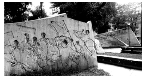
Figura 12. Imagen del Parque de los mártires universitarios, ganador del Primer Premio del Concurso. Elaborado por un equipo con la participación de los profesores Emilio Escobar y Mario Coyula.