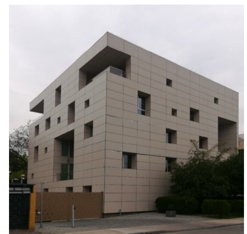
Figura 5 Edificio Corporativo Resiter.