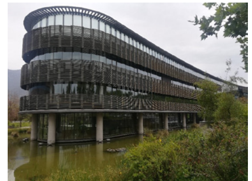
Figura 3 Edificio Transoceánica Business Park.

Las primeras certificaciones se dieron con herramientas como LEED y BREEAM que se aplicaron para algunos edificios insignes, como el nuevo edificio de la Cámara Chilena de la Construcción, el edificio Transoceánica Business Park (Figura 3), el Parque Titanium (Figura 4); la Torre Titanium; La Portada; el Edificio White; el I-Office de Costanera; el Edificio Territoria; El Bosque; el Edificio Corporativo Resiter (Figura 5), y el Centro parque explorador Quilapilun, entre muchos otros, algunos de los cuales obtuvieron las más altas calificaciones.