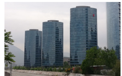
Figura 4 Parque Titanium.