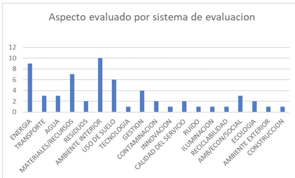
Figura 2. Metodologías de evaluación y aspectos evaluados. Fuente: Elaboración propia.

En Chile como en muchos países, la sustentabilidad comenzó por estrategias energéticas o puramente medioambientales por lo que en la primera década del siglo XXI se crean la Guía de Diseño para la eficiencia energética en la vivienda social; el Programa País de Eficiencia Energética (PPEE) 2005; y el Ministerio de Energía en 2010. Luego en la segunda década se dan pasos importantes, como la Estrategia Nacional de Construcción sustentable; la Certificación de Edificio sustentable 2012; los Estándares de Construcción Sustentable para Viviendas; el Manual de Elementos Urbanos Sustentables; y el Programa Estratégico Nacional de Productividad y Construcción Sustentable 2016, conocido coloquialmente como Construye 2025.