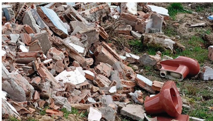
Figura 7. Vertederos informales de materiales de construcción.

En la Tabla 3 se presenta un resumen de las propuestas que se derivan de este estudio.