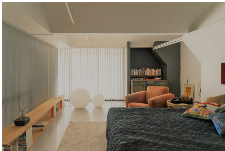
Figura 3. Casa Nau. Habitación principal, matrimonial.