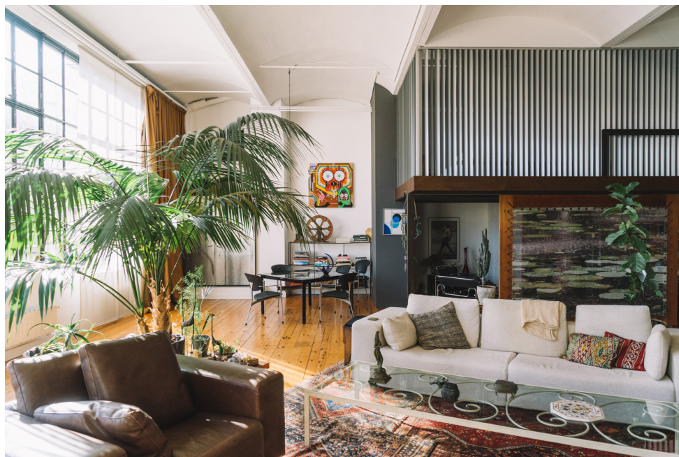
Figura 6. Casa Nau. En el área de estar elementos de diferentes culturas comparten armónicamente el espacio.