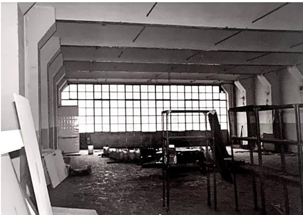
Figura 1. Casa Nau. Estructura de grandes luces propia del uso original del inmueble como nave de la industria textil 1922.

— El barrio de POBLE NOU de Barcelona, donde se encuentra la Casa Nau, sufría en los años 90, según mi parecer, innecesarias desapariciones de edificios industriales a causa de la modernización y especulación inmobiliaria. El destino quiso que encontrara este bello edificio de la industria textil de principios del siglo pasado, con contrafuertes, grandes luces estructurales, vueltas a la catalana y espléndidos ventanales, que iluminan y ventilan este amplio espacio. (Figura 1) Imaginé vivir en una de sus plantas y así comenzó el proyecto de transformación.