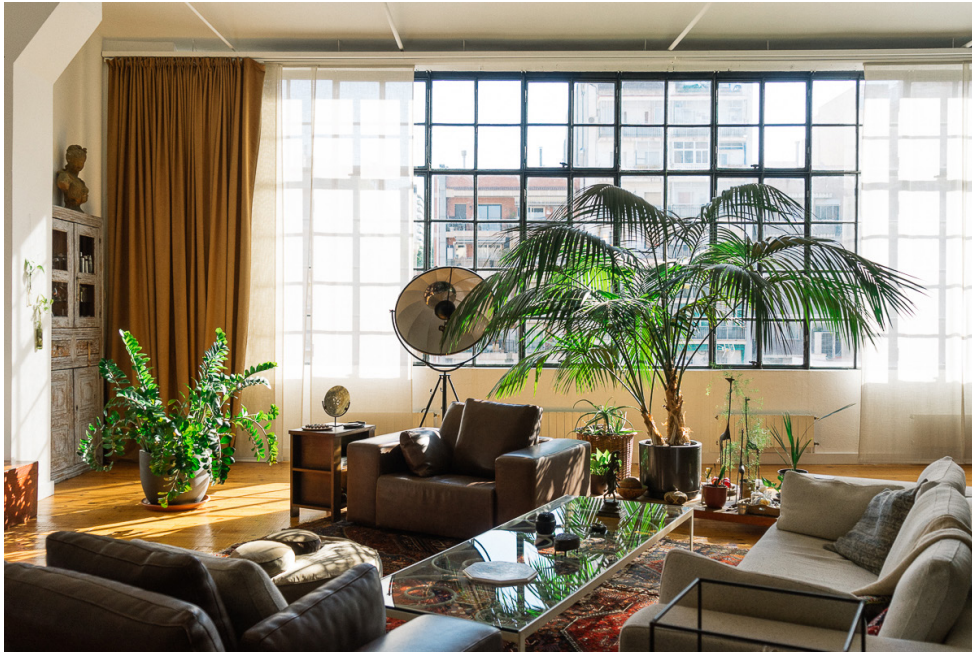
Figura 5. Casa Nau. Área de estar, delimitada por la alfombra y la disposición del mobiliario.

Otro aspecto importante es la armonía entre culturas, con la presencia de objetos traídos de nuestros viajes que se hermanan con diseños actuales o propios que le aportan su estilo intemporal a la casa. (Figura 6)