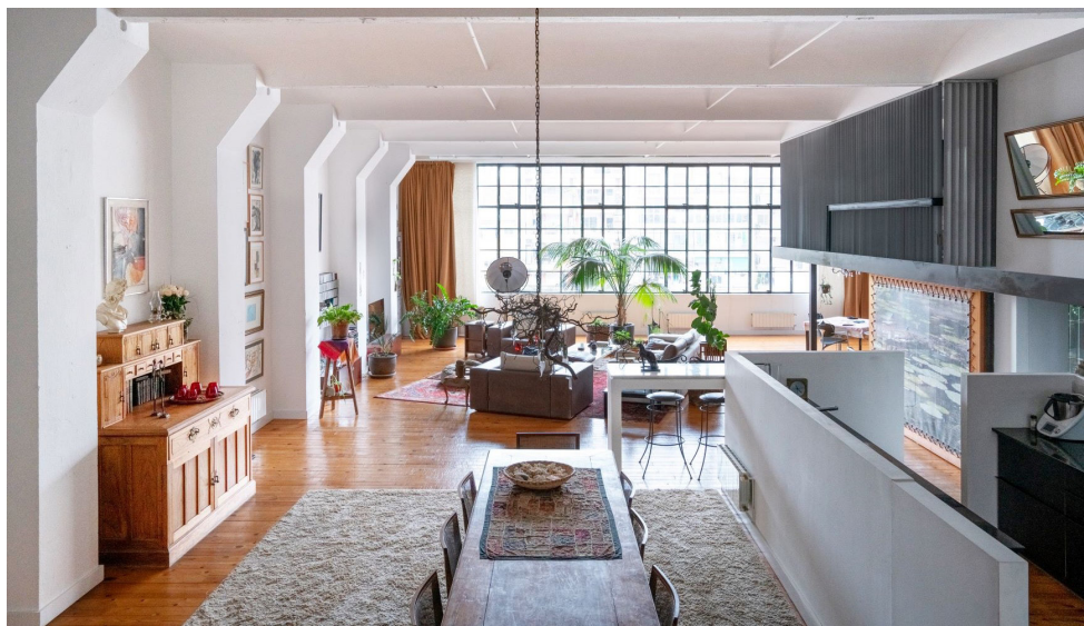
Figura 7. Casa Nau. Ventanal que cierra la fachada noreste es el protagonista del espacio.

En los días cálidos, permite aberturas superiores cruzadas que renuevan el aire y en los días fríos, un anillo de radiadores, en la parte inferior, crea una cortina de calor, que al atardecer se contiene con un cortinaje denso que frena la pérdida del calor confortable conseguido durante el día.