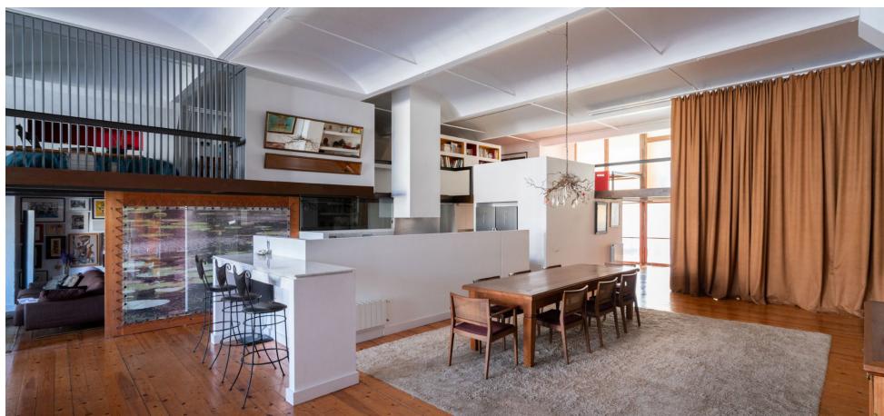
Figura 2. Casa Nau. Cocina. Articulación principal del amplio espacio donde se generan las diferentes áreas de uso familiar.

Siempre explico que es un gran espacio con rincones diferentes para la pareja como es la habitación-dormitorio principal (Figura 3) y un espacio cerrado para una hija pequeña, que el tiempo ha transformado en nuestro lugar de trabajo. (Figura 4)