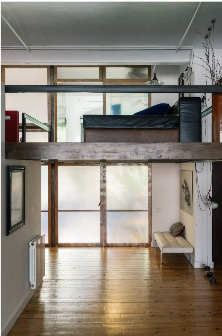
Figura 10. Casa Nau. Vestíbulo donde destaca la iluminación natural desde el ventanal de la fachada suroeste.

— Respetamos sus orígenes, pues es importante mostrar al barrio su historia industrial. Las tres familias vecinas que actualmente ocupamos el inmueble, una por cada planta, diseñamos nuestros nuevos ventanales con el propósito de destacar la transición entre el pasado y el presente, utilizando un color más oscuro que resaltara los ventanales y la escalera, y que señalara los dos accesos por la fachada suroeste (Figura 9). Se percibe un fuerte contraste entre los accesos desde el exterior, incluido el viaje en el ascensor de carga original de la nave con el espacio, a modo de vestíbulo con que nos recibe la Casa Nau (Figura 10).