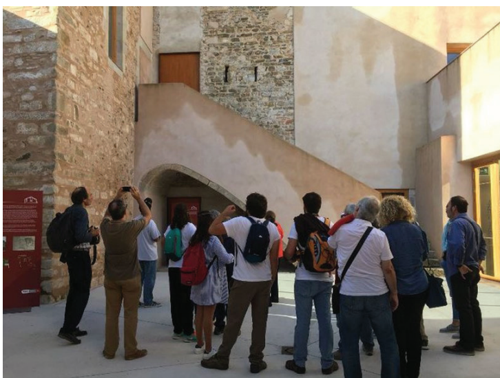
Figura 4. Open House Barcelona. Visitantes. Can Fargues. Escuela Municipal de Música. Foto: Autora, 2016.

El Open House en la ciudad se desarrolla de forma gratuita, presencial y guiada, mayoritariamente a través de visitas a edificios (Figura 4), estudios de arquitectura y recorridos por la ciudad, aunque también se programan conferencias, exposiciones y otras actividades culturales, algunas dirigidas a personal especializado, que acercan la ciudad y su Arquitectura a la población.