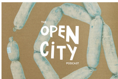
Figura 6. Imagen promocional. Podcast The Alternative Guide to the London Boroughs . Owen Hatherly. 2020.