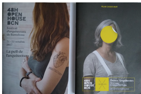
Figura 5. Programas impresos Open House Barcelona. Años 2017 y 2019.