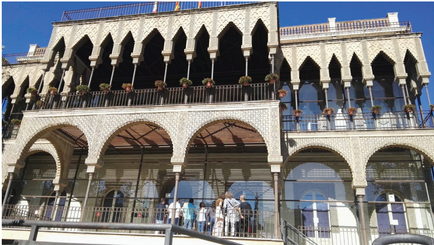
Casa de las Alturas. Visitantes. Open House Barcelona 2019.