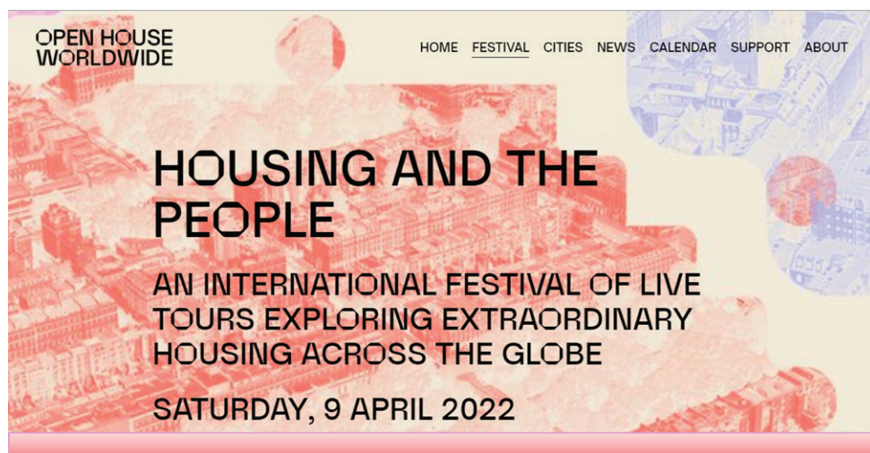
Figura 2. Open House Worldwide. Housing and the people. Festival internacional online. 2022.

duda de que, la piedra angular, la razón de ser del Open House , es el evento de ciudad donde el papel y la participación de la población en general y de los voluntarios en particular es determinante. De hecho, una buena parte de los voluntarios salen de los propios barrios que se recorren durante las jornadas y donde se encuentran los edificios que se visitan.