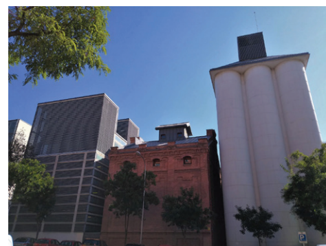
Figura 8. Complejo El Águila, Madrid. Fachada Calle General Lacy. Vista parcial.

Se sugiere como buena práctica “realizar un debate o intercambio al final de la visita como complemento apropiado si se programaran recorridos con más de una hora, o al menos ajustados a la complejidad y tamaño de la obra visitada 16 [Figura 8], pues quizás el tiempo resultó insuficiente para descubrir más características de una instalación de esa magnitud” 17