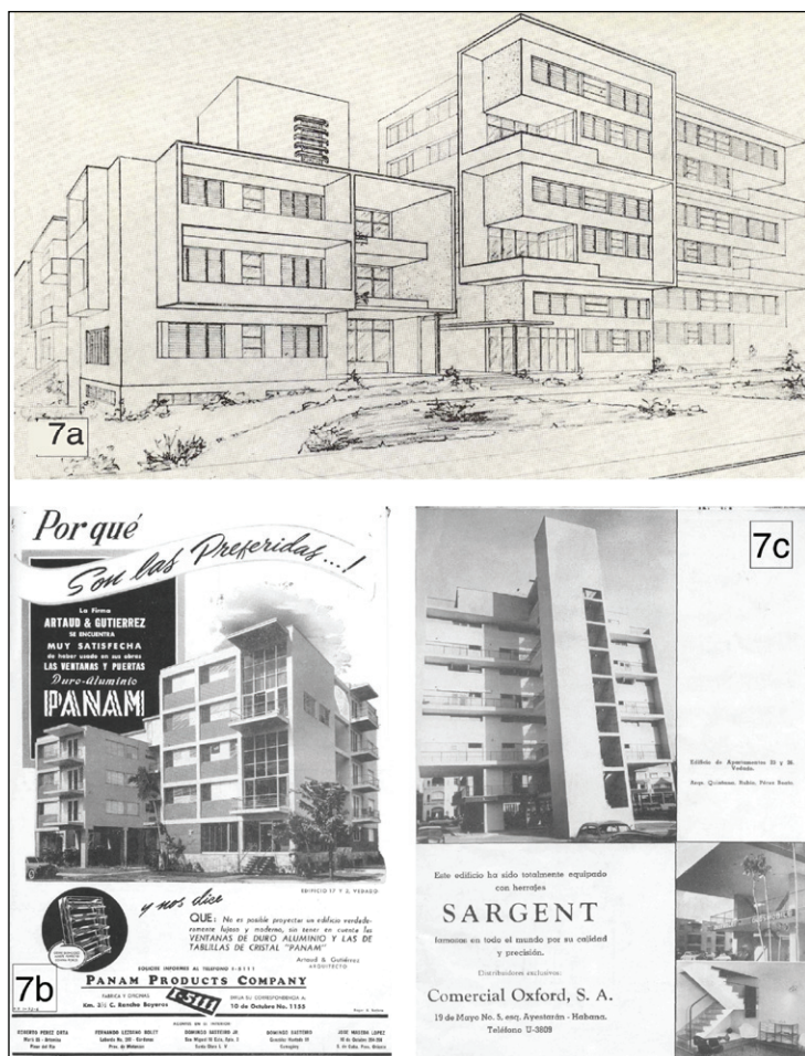
Figura 7. 7a) Edificio de apartamentos para la Occidental Trading Co., reparto Alturas del Vedado (Arq. Silvia O' Bourque Reyes, 1951). 7b) Edificio de apartamentos, Calle 17 No. 800-802, El Vedado, para la Cía. de Inversiones Fanza, S.A. (Artaud y Gutiérrez, Arquitectos, 1951) (Tabla 1, No. 14). 7c) Fachada posterior y detalles del edificio dúplex de 23 y 26, El Vedado (1950) (Tabla 1, No. 6).

Por su diseño racional y su concepto de belleza sin decoración adosada, el edificio dúplex se convirtió también en una referencia dentro de la retícula ciudadana. El precio de venta diferenciado de ese tipo de apartamentos permitía a sus propietarios adquirir los lotes de esquina, que habían permanecido sin ocupación dentro de la trama urbana por su alto costo. Entre los ejemplos más conocidos se encuentran los edificios de apartamentos situados en 16 y Calzada; 17 y 2; 21 y 2; Paseo y Línea; 23 y D; y San Lázaro y Marina.