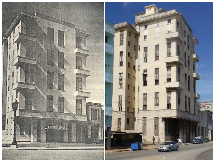
Figura 1. Edificio denominado con toda intención Dúplex, primero de su tipo en Cuba, 1943-44 (Tabla 1, No.2).