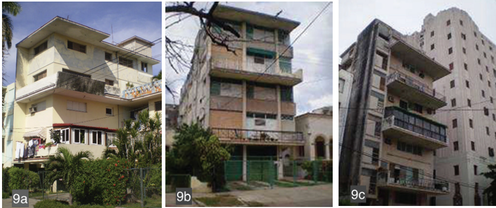
Figura 9. Tres edificios de apartamentos de 1954, con concepción similar: las células dúplex definen la expresión arquitectónica de la fachada principal, y detrás, se desarrollan apartamentos sencillos en varios pisos: 9a) Ave. 3ra No. 9606, Playa (Tabla 1, No.17); 9b) Calle 19 No.1318, Vedado (Tabla 1, No.20) y 9c) Calle L No.107-109, Vedado (Tabla 1, No. 19).

[11] Valladares ÁL. Urbanismo y Construcción. 2da ed. La Habana: P. Fernández y Cía.; 1954.