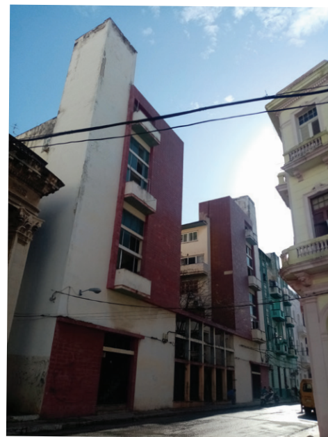
Figura 2. Conjunto de viviendas económicas de la calle Espada No. 5-7, Centro Habana, 1946 (Tabla 1, No. 3).