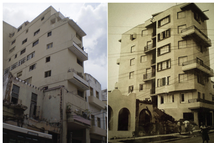
Figura 8. No se trata del mismo edificio, aunque el ritmo de los balcones en voladizo los hace muy similares. Izquierda: Edificio TRANSACO, Galiano No.115, Centro Habana, 1954 (Tabla 1, No. 18). Derecha: Edificio Dúplex, Ave. 63, Marianao, 1953- 1956 (Tabla 1, No.15).

En el actual municipio Centro Habana, y también en Marianao, la receta dúplex permitió obtener el mayor provecho a lotes irregulares, estrechos y largos, todavía libres, o que fueron obtenidos como resultado de demoliciones hechas con el fin de «modernizar» la imagen urbana de esas zonas de la ciudad. (Figura 8)