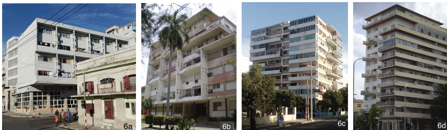
Figura 6. Algunos edificios de apartamentos que incluyen apartamentos dúplex. 6a) Edificio 1005, San Lázaro No. 872, Centro Habana. 1951 (Tabla 1, No. 12); 6b) Edificio de apartamentos, Calle 21 No. 802, Vedado, 1951 (Tabla 1, No. 11); 6c) Edificio de apartamentos, Calle 23 No. 670-672, Vedado, 1955. (Tabla 1, No. 24) y 6d) Edificio NAROCA, Paseo No. 158, Vedado, 1955 (Tabla 1, No. 21).

Así, la combinación de células dúplex y apartamentos sencillos dentro de una misma construcción se convirtió en un recurso atrayente para el diseño y la concepción volumétrica de los edificios. La diferencia en altura de ambas soluciones, los ritmos desiguales de balcones, así como la inserción de paneles divisorios para dar privacidad a un apartamento del otro, creó efectos plásticos interesantes, entrantes y salientes, juego de luces y sombras, lo que ayudó a definir la geometría exterior de las obras. (Figura 6)