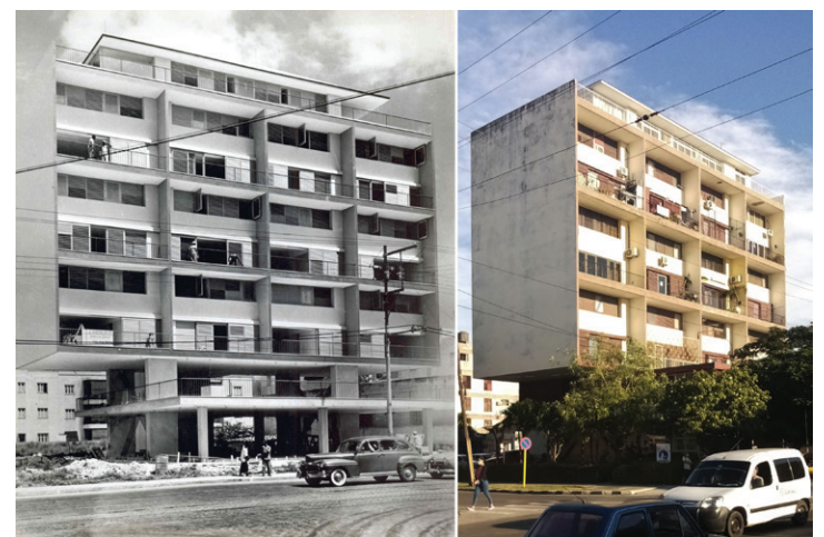
Figura 4. Edificio Dúplex, calle 23 No. 1516, esquina a 26, Vedado, 1950 (Tabla 1, No. 6).