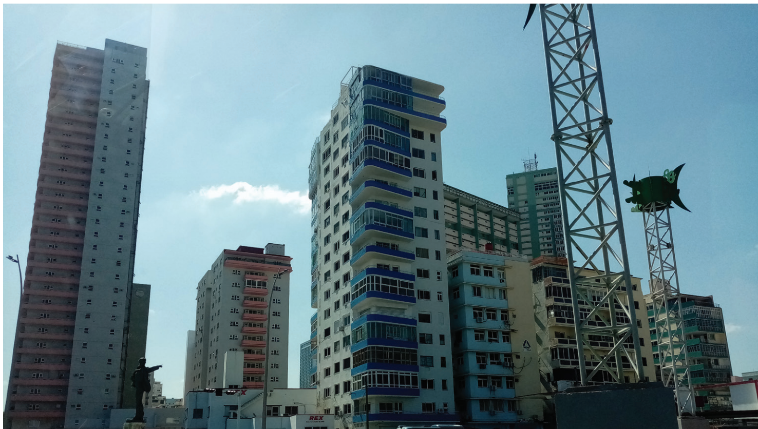
Rascacielos de La Habana. La silueta habanera de los cincuentas se ha mantenido prácticamente invariable por más de seis décadas.