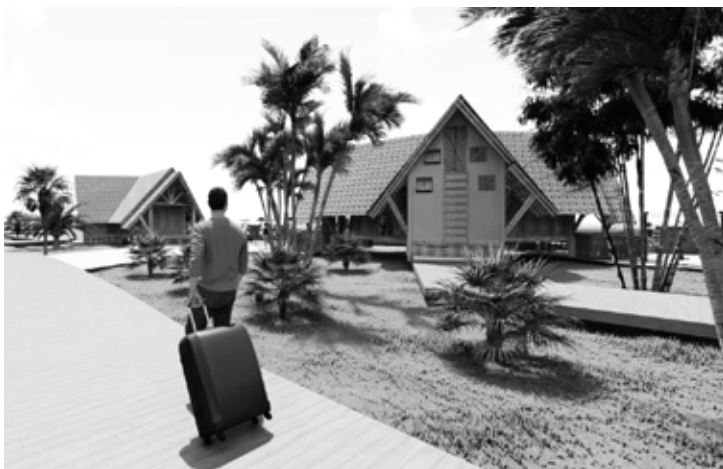
Figura 6. Propuesta de villa turística de bambú en Corralillo, Villa Clara. Esquema de la zona de alojamiento.