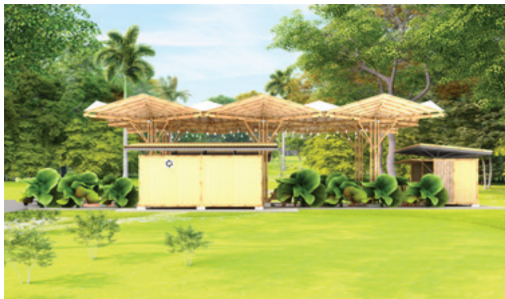
Figura 7. Propuesta del uso del bambú en espacios: mercado.

Dentro de los componentes, se indagaron posibles usos del bambú en techumbres, cierres, cercados y elementos similares (Figuras 9 y 10). En general, se trataba de espacios y de componentes que habitualmente no están incluidos en los grandes planes constructivos, o no son considerados por las administraciones locales, por lo que no se ejecutan, o se solucionan con precariedad por parte de la población.