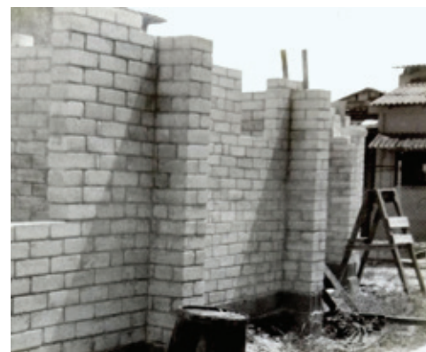
Figura 2. Construcción experimental de bajo consumo energético y material, en Cocosolo, La Habana, 1990-93, con bloques de suelo local estabilizados con cemento Portland (5-7%). Proyectistas: Alfonso Alfonso, Gabriela Peterssen y otros colaboradores del Programa del ISPJAE-RDA.

En el Instituto Superior Politécnico José Antonio Echeverría, ISPJAE 1 , por ejemplo, se investigaron diversos materiales alternativos, elaborados a base de adobe y tierra compactada, suelo prensado, lodo de papel, emulsiones geotérmicas, residuos arcillosos, fibras, cáscaras, residuos industriales y de la producción agrícola, u otros aglomerados [4] (Figuras 2 y 3).