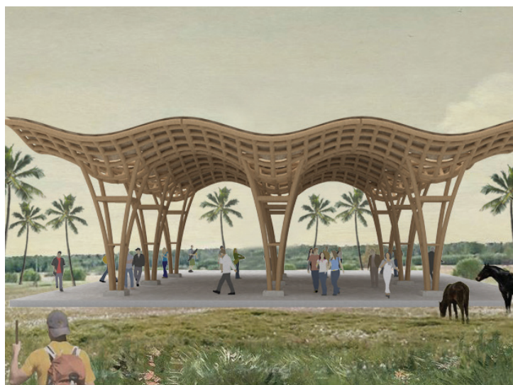
Figura 10. Propuesta del uso del bambú en el diseño de componentes de techos en instalaciones productivas. Fuente: Ramírez y Moreno, 2024 [31].