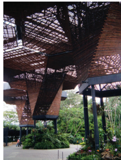
Figura 1. Colombia es uno de los países de América con más desarrollo en el uso del bambú en la construcción. La foto muestra una estructura construida con este material en el Jardín Botánico de Medellín. Fotografía: M. R. Matamoras, 2011.