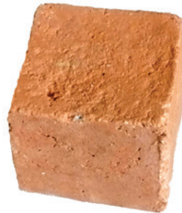
Figura 3. Muestra de material experimental de construcción económico, ecológico, ahorrador de energía, y con excelentes prestaciones físico-resistentes, elaborado con residuos industriales, sin incluir cemento, producido en 1992 en la Facultad de Arquitectura del ISPJAE.