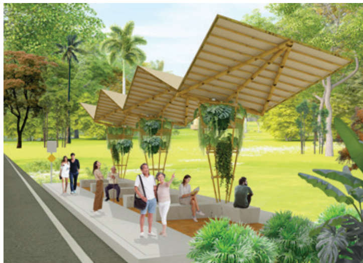
Figura 8. Propuesta del uso del bambú en espacios: parada de ómnibus.

Las soluciones que se derivan de las fases propositivas de este trabajo, abarcaron con toda intención, diferentes escalas del diseño, desde un conjunto hotelero hasta una simple estructura para cobijo, o para reponer partes deterioradas de una obra existente. Sin embargo, todas tienen en común que fueron concebidas a partir de un material de comprobadas propiedades ecológicas. Su cultivo y explotación podrían no sólo contribuir a sanear el medio ambiente y beneficiar los suelos, sino también, convertirse en fuente de empleo para muchas personas, impulsando la prosperidad colectiva. En sentido general, el bambú podría sustituir de forma alternativa a materiales como la madera y otros cuya producción, procesamiento y extracción demandan cantidades considerables de energía o degradan extensos territorios, con la consiguiente contaminación