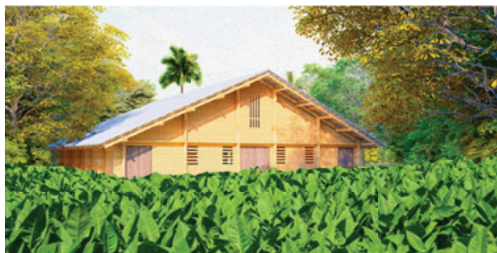
Figura 9. Propuesta del uso del bambú en componentes de paredes y estructura del techo de una casa de tabaco para la reconstrucción pos-desastre. Fuente: Ramírez y Moreno, 2024 [31].