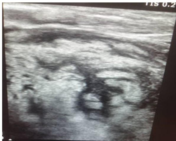
Fig. 2. Ecografía escrotal: masa hipoecogénica extratesticular sólida de 10 cm.

Se realizó una tomografía computarizada contrastada de tórax, abdomen y pelvis, que descartó la existencia de metástasis. Otras investigaciones, incluida alfafetoproteína y gonadotropina coriónica humana, detección del virus de la inmunodeficiencia humana y radiografía de tórax —vista postero-anterior—, fueron normales.