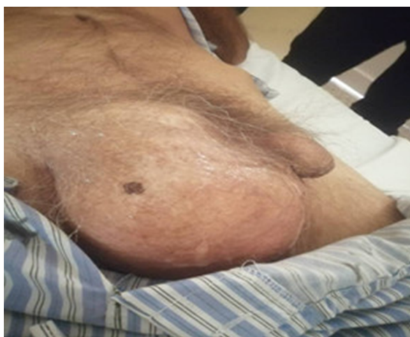
Fig. 1. Masa inguinoescrotal derecha.

Examen físico: masa inguinoescrotal derecha indolora de aproximadamente 15 cm de largo. (Figura 1)