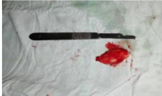
Fig. 2 - Obsérvese el sialolito una vez extraído del conducto.