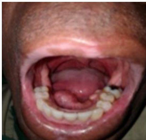
Fig. 1 - Aumento de volumen en la zona derecha del suelo de la boca.

Boca: paciente desdentado parcial superior e inferior no rehabilitado con prótesis, aumento de volumen de 4 cm de largo a nivel del lado derecho del suelo de la boca que guardaba relación con el conducto de la glándula submandibular, eritematoso, con presencia de puntos que drenaban pus a los movimientos, consistencia duro-pétreo, dolor referido a la fonación, masticación y deglución, con proyección de la lengua hacia la izquierda y hacia arriba así como pérdida parcial de la motilidad (Fig. 1).