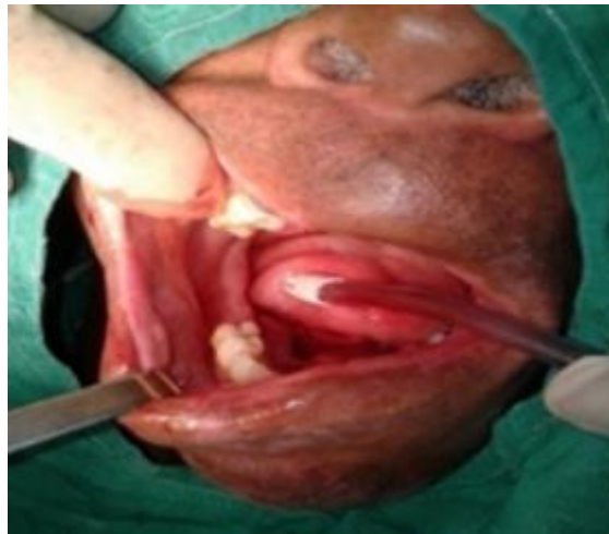
Fig. 3 - Obsérvese boca del paciente inmediatamente después de la cirugía.