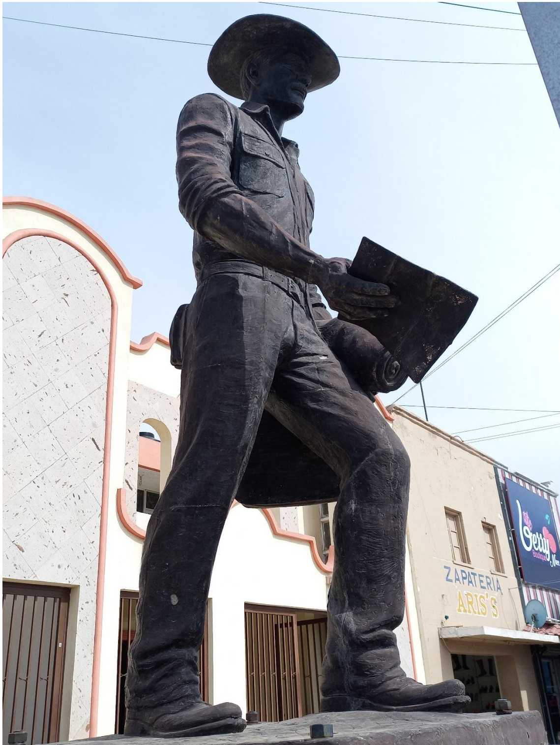
Créditos: Monumento Al bracero, Empalme, Sonora. Foto: Noé Josué Valenzuela Tapia.

Develado en octubre del año 2016, el monumento Al bracero en la ciudad de Empalme subraya la comprensión de doña Lidia sobre las narrativas de la memoria y las múltiples formas en las que se puede reivindicar el papel de los trabajadores agrícolas a partir del patrimonio material. El monumento devela