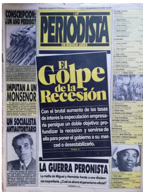
El Periodista, núm. 15, 22-28/12/1984. Portada

De esta forma, EP de acuerdo con su lectura política de la economía reunía con relación instrumental a los militares defensores de la dictadura con el sistema financiero –las derechas “económica” y “política” definidas en el diálogo con Grinspun– como componentes de la conjura contra la democracia (Raíces, 2023). Sintetizaba, así, un supuesto sostenido desde la sección económica referente a la incompatibilidad esencial entre la gran burguesía empresarial y agraria salientes de la dictadura, aliadas de la banca, y cualquier expectativa de desarrollo hacia el orden interno con redistribución. 7 Por otra parte, el titular antedicho anticipó una expresión posteriormente popularizada como “golpe de mercado”; mientras que, al hablarse de la “desestabilización”, era retomaba la empleada desde la esfera oficial para señalar a quienes