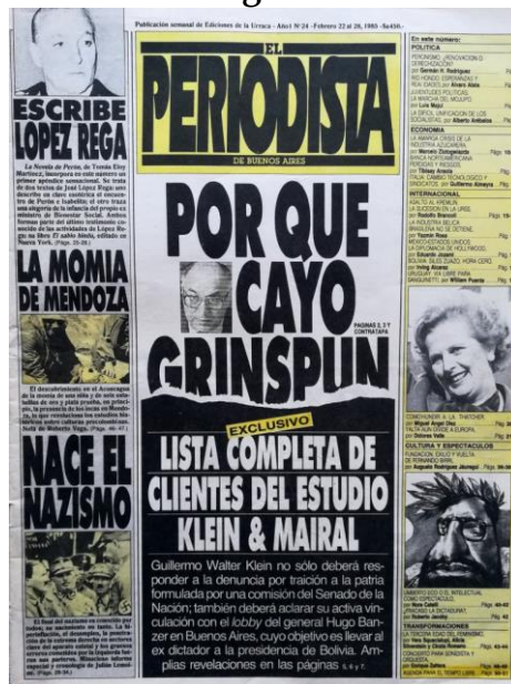
El Periodista, núm. 24, 22-28/02/1985. Portada

El suceso era calificado como el cambio gubernamental más importante desde su asunción. Ábalo situaba el fin del ciclo de Grinspun entre los problemas de gestión y sus características personales. Por una parte, claves en