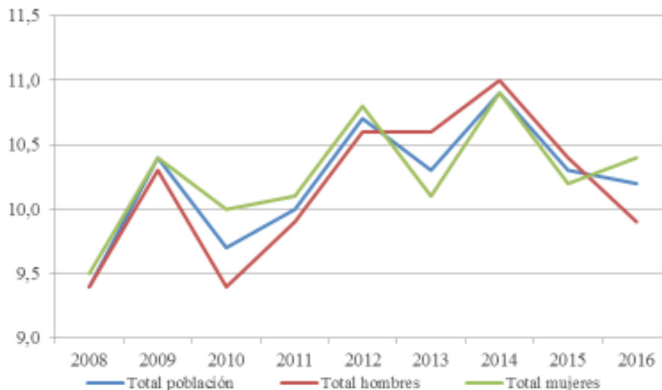
Gráfico 3– Evolución la población en situación de sobreesfuerzo económico a la vivienda por sexo, España 2008-2017.

Fuente: European Survey on Income and Living Conditions (EU-SILC), EUROSTAT.