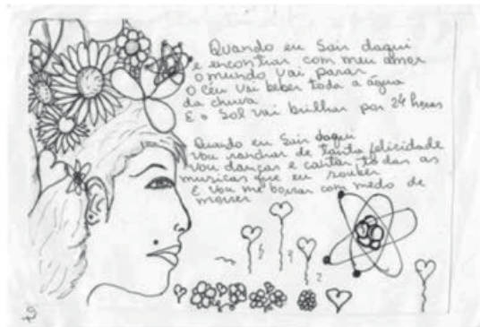
Figura 2 – Poesia da liberdade

Encantam". Foi durante as rebeliões que os presos "faccionados" exigiram a retirada de todos os presos LGBTI+ da CPPLIII e também das demais unidades prisionais em que presos filiados às "facções" estivessem cumprindo pena. O momento aterrador da rebelião é relatado na edição produzida logo após o ocorrido.