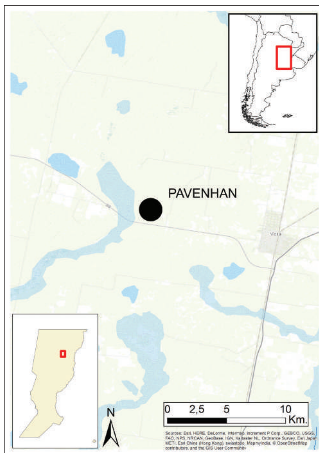
Fig. 1. Localización del sitio arqueológico Pavenhan.