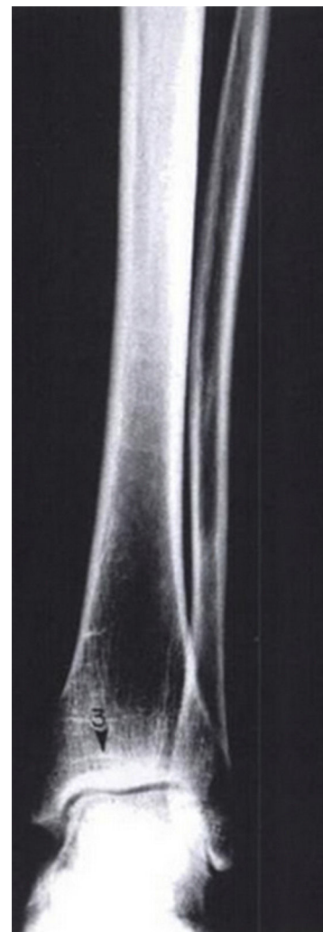
Figura 6 Líneas de Harris en una momia egipcia (detalle).