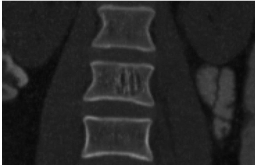
Fig. 1 Paciente femenino de 35 años con diagnóstico de cáncer uterino. Reconstrucción coronal de TC, en la que se visualiza una lesión a nivel del cuerpo vertebral compatible con hemangioma intraóseo, conformando el signo de las barras de cárcel.