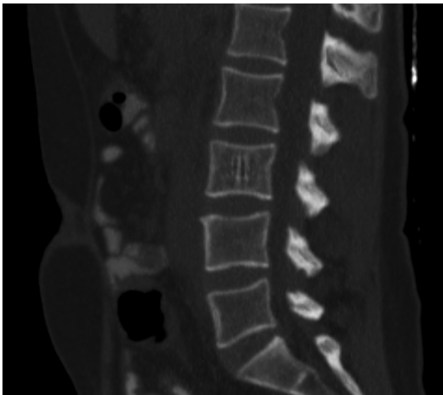
Fig. 3 Paciente de 58 años con diagnóstico de carcinoma gástrico. Reconstrucción sagital de TC, en la que se reconoce otra lesión con un patrón estriado vertical compatible con hemangioma intraóseo, característico del signo de las barras de cárcel.

lesiones destructivas (metástasis), 4 las características en RM no son patognomónicas y deben incluirse metástasis, linfoma, mieloma múltiple, enfermedad de Paget, TBC vertebral y discrasias hematológicas, entre otras. 1