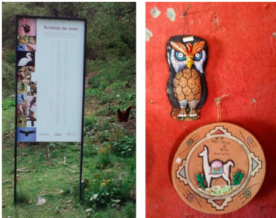
FIGURA 5. Cartelería oficial del Parque.

Enumeración de especies ornitológicas autóctonas, que ignora las gallinas domésticas de las familias (izquierda) y productos a la venta en el puesto de recuerdos cercano al Guayacán (derecha).