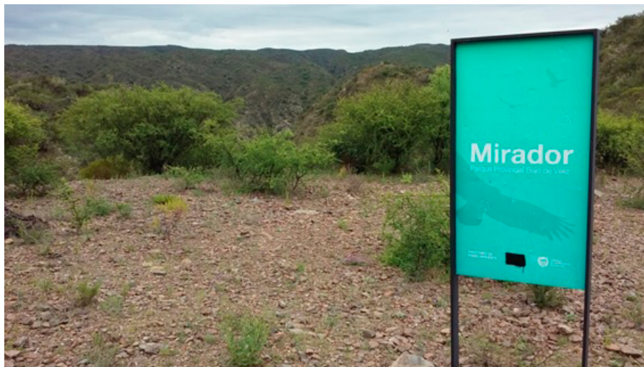
FIGURA 2. Mirador en la entrada al Bajo de Véliz.