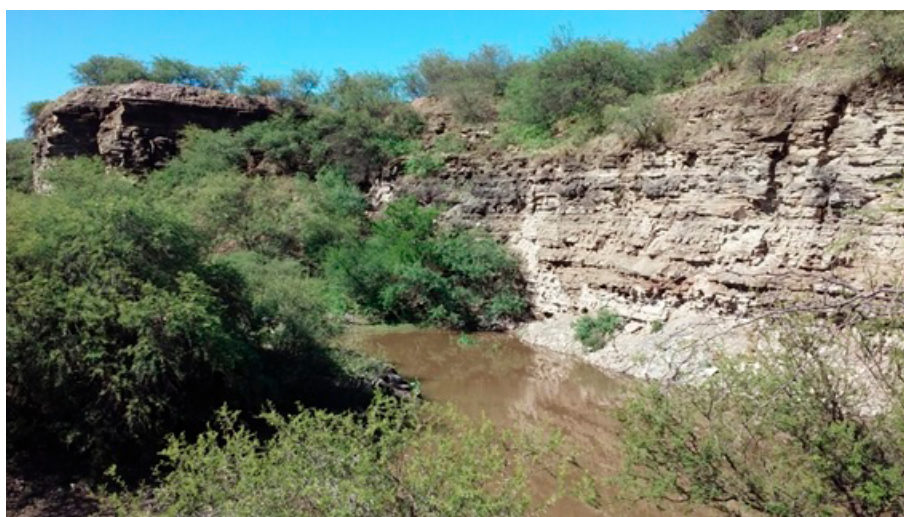
FIGURA 3B Paredón de la cantera

La cinta asfáltica finaliza en una rotonda, de la que parten dos de los senderos marcados por la administración del parque. El primero va hacia uno de los sectores con presencia de morteros comechingones sobre el arroyo, y pasa por las inmediaciones de una de las casas. El segundo va hacia el Guayacán descrito en el plan de manejo. El tercer sendero es el que recorre la cantera abandonada, epicentro de los hallazgos paleontológicos de la zona. Su ingreso está sobre la ruta, poco antes de llegar a su final. Está delimitado por una tranquera, sobre la que, además de la cartelería turística, se encuentran carteles elaborados por la comunidad reclamando la propiedad de la tierra, como testimonios del conflicto por la expropiación (Fig. 3a). Frente a la tranquera, del otro lado de la ruta, un descampado oficia de playa de estacionamiento. A la izquierda del ingreso al parque, se halla una vivienda con un pequeño huerto con distintos cultivos, cuyo límite es una lomada de varios metros de altura. “Son todos escombros de la cantera”, afirma el dueño de la casa, que trabajó en ella hasta su cierre, y para quien “está bien que haya turismo, deja algo de plata”. Además, sostiene que está “contento con la ruta, porque el camino era muy jodido. Igual, seguimos complicados con las crecidas.