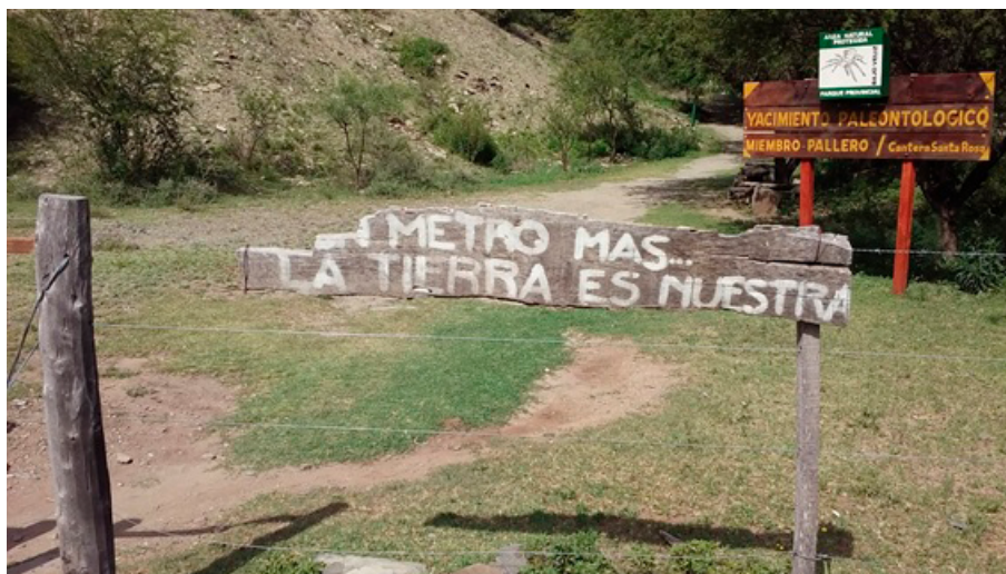
FIGURA 3A Huellas del conflicto: entrada