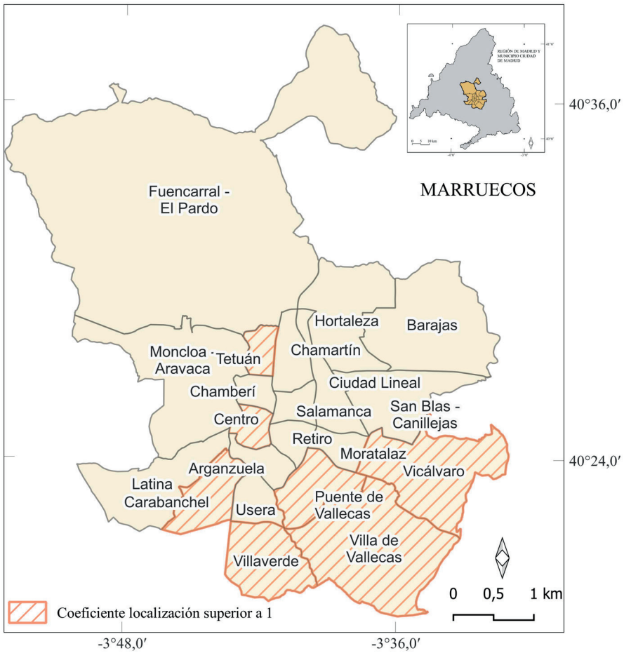
Figura 6. Distritos con concentración de inmigrantes procedentes de Marruecos.

Tras el análisis cuantitativo de la segregación étnica en la ciudad de Madrid, se ha procedido a la realización de un trabajo de campo en aquellos barrios que han alcanzado un valor elevado en el Cociente de Localización para alguno de los colectivos de inmigrantes analizados, con el fin de analizar, con técnicas cualitativas, la convivencia de los hijos de inmigrantes en el vecindario. Además, en el trabajo de campo se ha incluido el barrio de Embajadores, comúnmente llamado Lavapiés que, aunque no alcanza valores muy elevados de concentración de los principales colectivos de inmigrantes en Madrid, es un barrio con una alta proporción de extranjeros, en general, y con marcadas características de enclave étnico (Jiménez Blasco, Resino, Mayoral y Sassano, 2020).