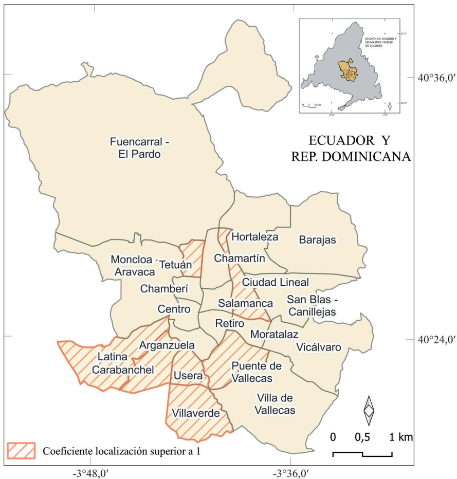
Figura 3. Distritos con concentración de inmigrantes procedentes de Ecuador y República Dominicana.