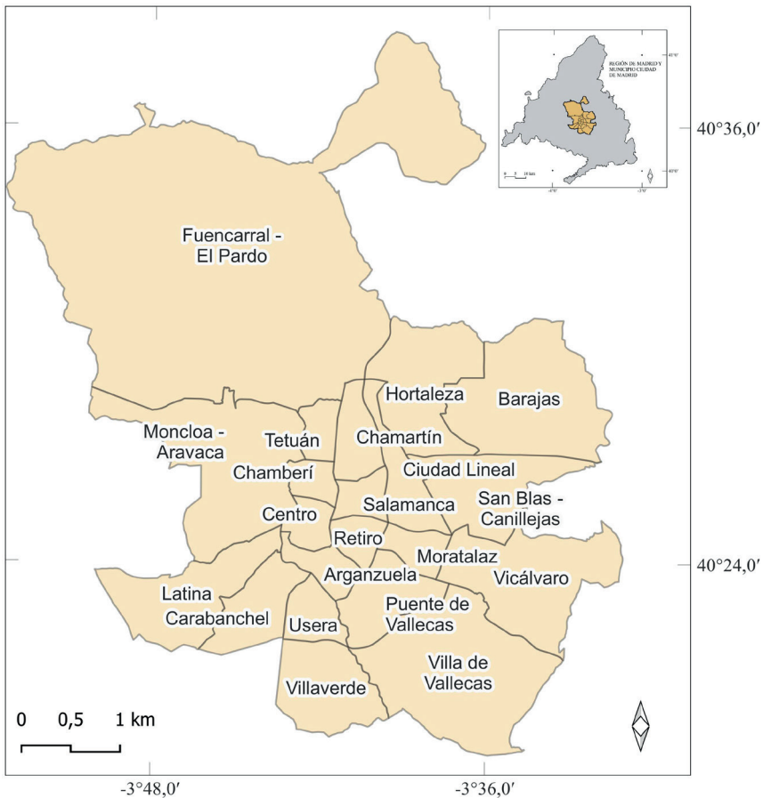
Figura 2. Distritos Ciudad de Madrid.

Hasta el último cuarto del siglo XX la segregación étnica fue característica de las ciudades de los Estados Unidos y de algunas grandes ciudades europeas con altas tasas de inmigración internacional (Capel, 1997; Gober, 2000). En la actualidad países del Sur de Europa, como España, reciben una fuerte corriente migratoria desde numerosos lugares del mundo (Arbaci y Malheiros, 2010), por lo que es posible que en sus grandes ciudades pueda identificarse el fenómeno de la segregación étnica (Martínez del Olmo y Leal Maldonado, 2008; Checa Olmos, Arjona Garrido y Checa Olmos, 2011), hecho que no se pudo constatar hace algo más de 30 años (Jiménez Blasco, 1984). Para este trabajo se han seleccionado los colectivos de origen inmigrante con mayor número de inmigrantes en la ciudad de Madrid (Fig. 2), municipio de la Comunidad con mayor número de inmigrantes en términos absolutos y relativos (Jiménez Blasco y Mayoral, 2020).