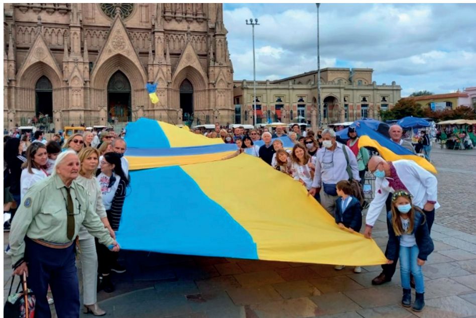
Figura 6. Escenas del exterior de la Basílica (plaza Belgrano).

Esta nueva realidad geográfica, también, desmantela el entramado de lugares presentes en las etapas anteriores: al desaparecer la estación Basílica se esfuma su lugaridad, al anularse la jornada recreativa y social de la tarde, se deslugarizan los recreos ribereños y las áreas de ocio, y todo se monopoliza en torno a la Basílica y la plaza que se configura como interioridad existencial (Relph, 1976). La peregrinación continúa alterando su morfología trazada por su locale , sus localizaciones y sentidos de lugar, siguiendo el esquema de Agnew (1987). El líder de Prosvita ponía en palabras esta realidad peregrina que experimentan actualmente: