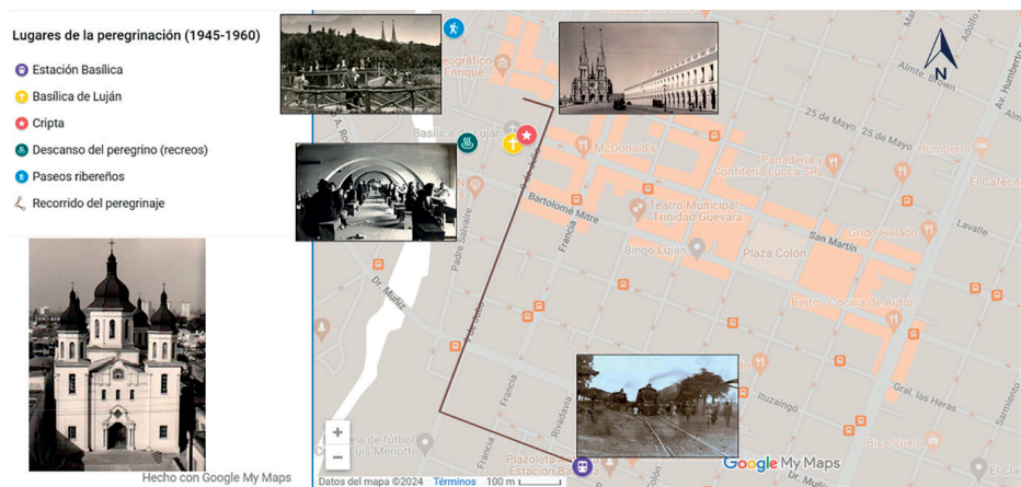
Figura 2. Lugares del paisaje peregrino en el arribo a Luján (1950). Escala: 1 = 100 m.