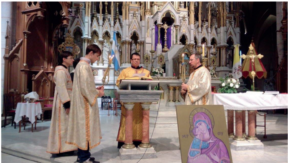
Figura 5. Ceremonia litúrgica en el interior de la basílica donde resalta la iconografía del rito bizantino.

Esta exterioridad, sin embargo, ocurre en el marco de un espacio físico cerrado y limitado, como es el interior del templo (Fig. 5).