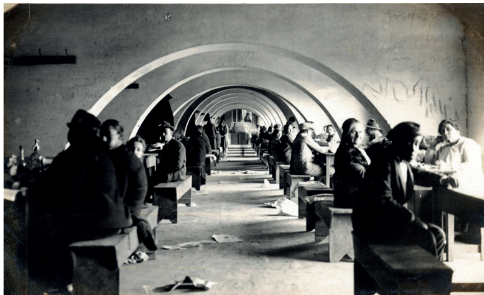
Figura 4. Muchas de las comunidades migrantes peregrinas utilizaron el Recreo del peregrino para llevar adelante actividades de ocio y recreación.

El periódico comunitario retrataba toda la escena, al enfatizar el éxito de la jornada y subrayando el papel (político y social) que jugó el Exarcado en la organización de esa movilidad a Luján: