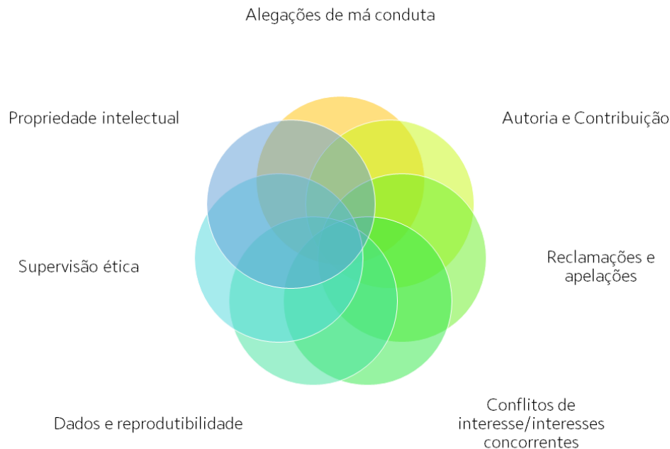
Figura 3 – Práticas essenciais do COPE.

As práticas essenciais (Figura 3) do COPE foram desenvolvidas em 2017, e são aplicáveis a todos os envolvidos na publicação de literatura acadêmica: editores e seus periódicos, editores e instituições. Estas sugerem que devem ser consideradas juntamente com códigos de conduta nacionais e internacionais específicos para pesquisa.