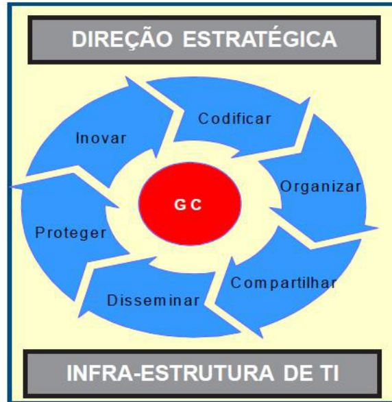
Figura 1 – Ciclo do conhecimento.

Há uma cadeia de procedimentos complexos que impacta diretamente o caminho percorrido e os resultados obtidos dentro dos processos de gestão, visto que é no planejamento e ordenação que se fundam os percursos para obter a informação e o conhecimento. Isto posto, a GC se constitui como um processo cíclico que envolve codificar, organizar, compartilhar, disseminar, proteger e inovar em meio a uma infraestrutura de Tecnologias da Informação (TI) e de uma direção estratégica, conforme exposto na Figura 1.