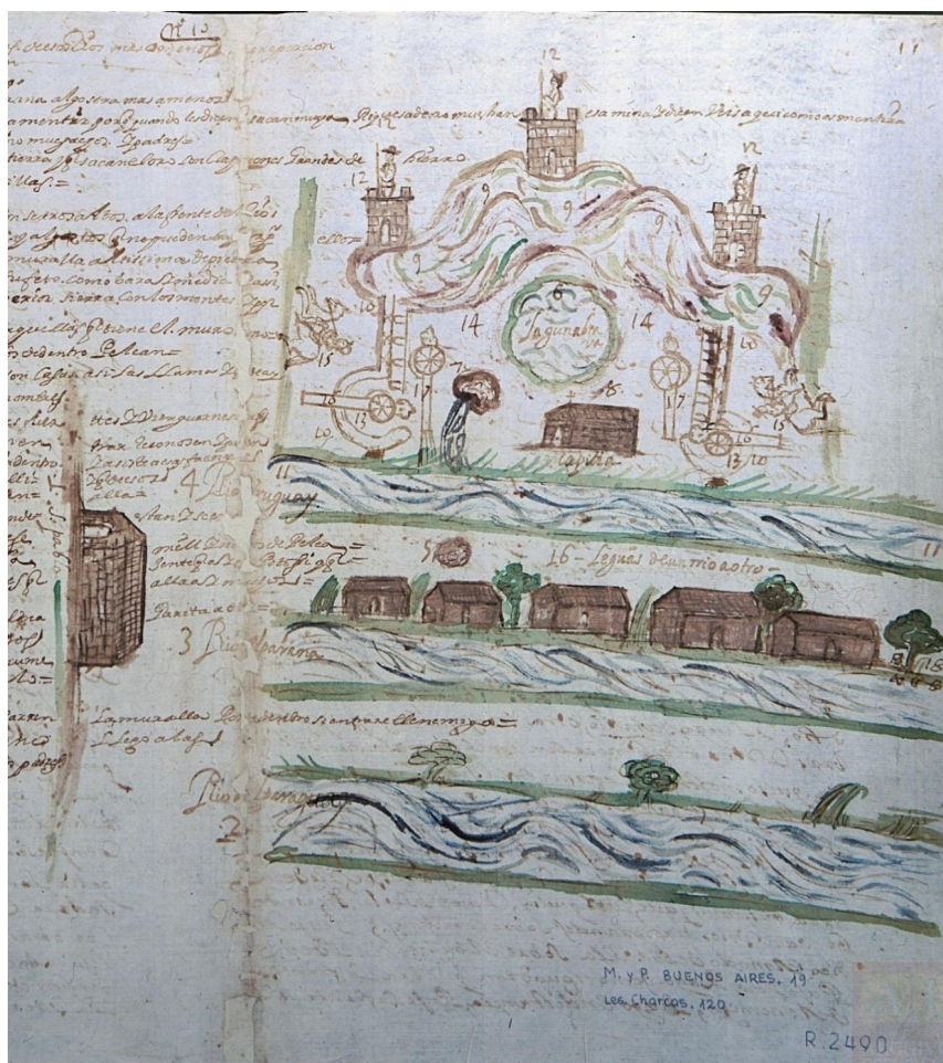
Figura 2: Mapa de las minas de oro de los jesuitas