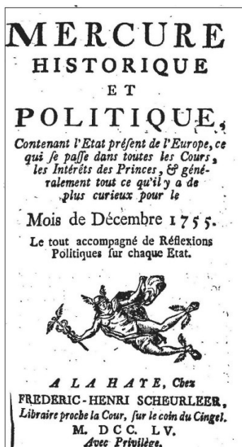
Figura 3: El Mercure , uno de los principales medios de Europa