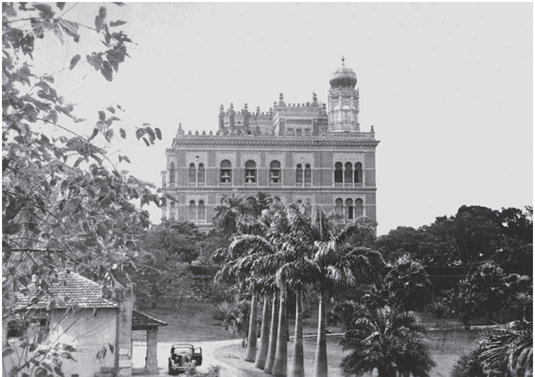
Figura 9: Vista lateral do Pavilhão Mourisco, Rio de Janeiro [1917?]