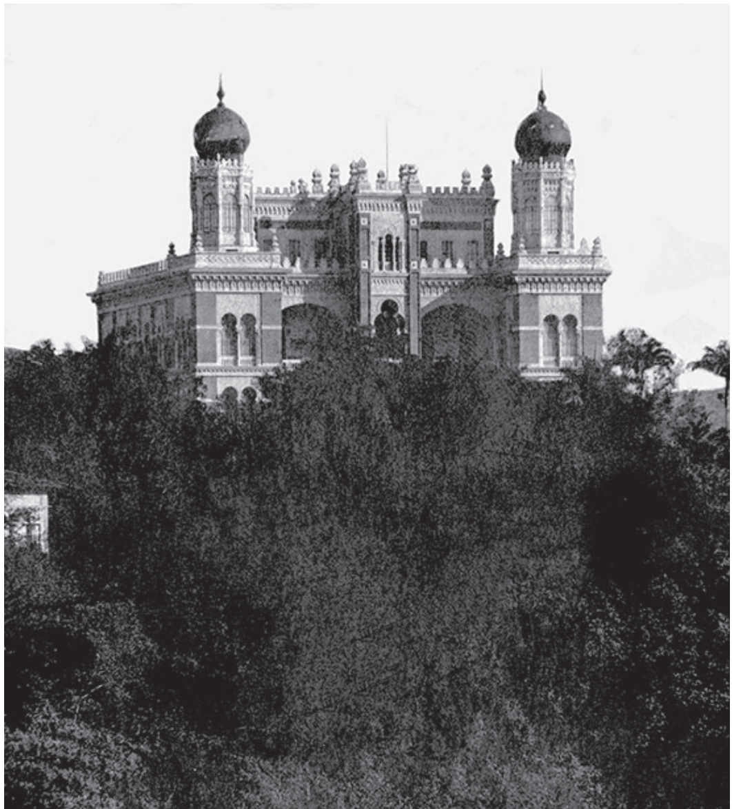
Figura 8: Vista da fachada do Pavilhão Mourisco [1910]