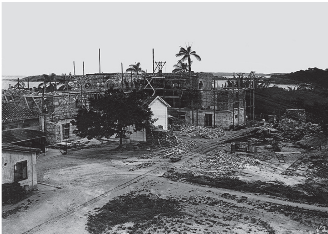
Figura 6: Vista do campus, s.d.