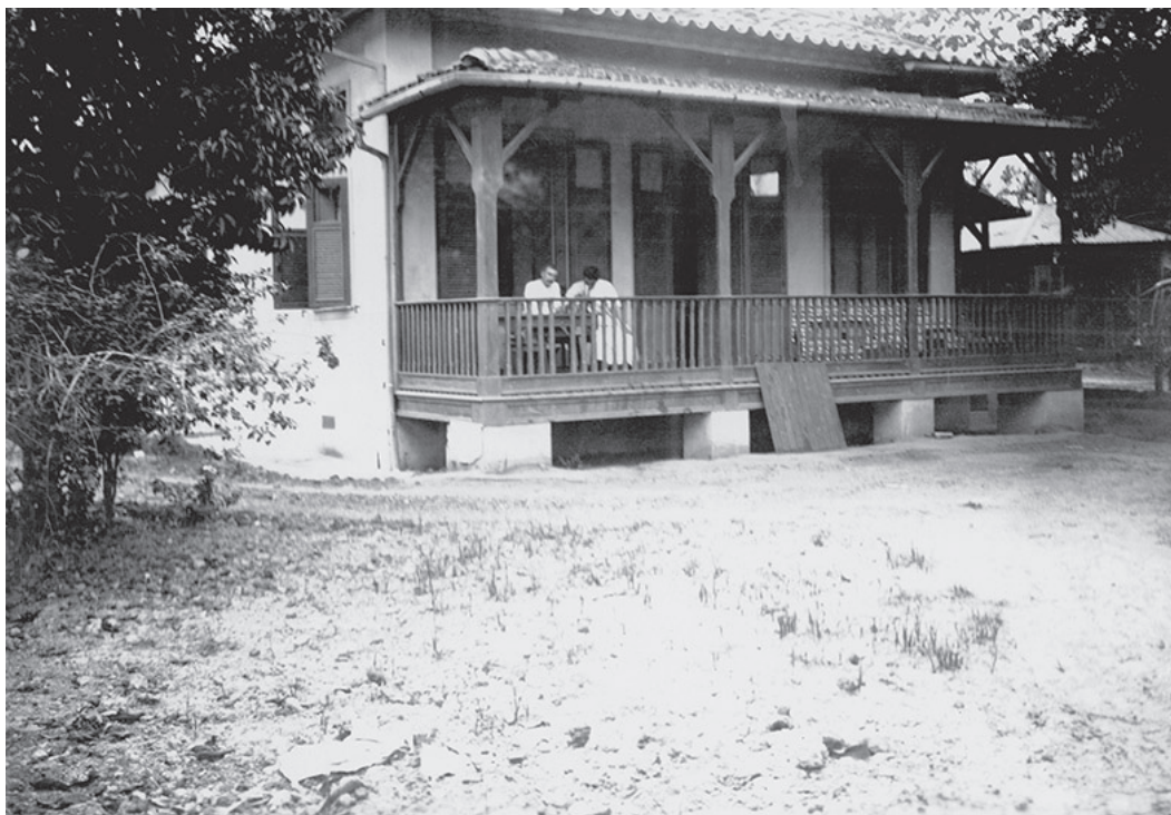
Figura 5: Varanda do antigo laboratório, Rio de Janeiro [1903]