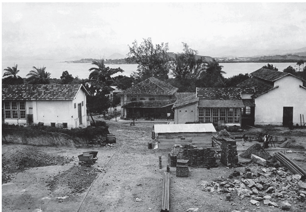
Figura 3: Vista geral das instalações do Instituto Soroterápico Federal em 1900; ao centro, o laboratório; à direita, a coqueira; e, à esquerda, o biotério; Rio de Janeiro [1900-1903?]