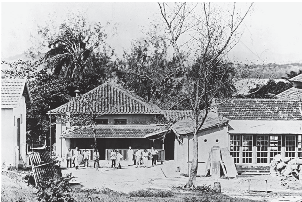
Figura 1: Fazenda de Manguinhos [1900-1903]