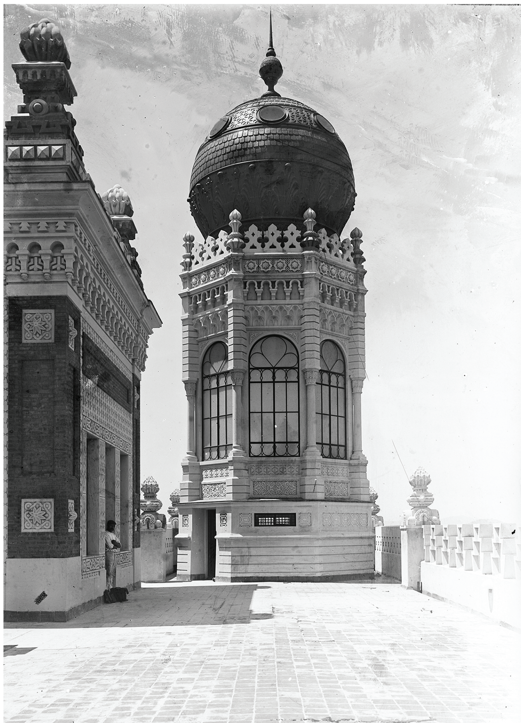
Figura 12: Vista de trecho do terraço do Pavilhão Mourisco e torre, Rio de Janeiro [1920-1930]