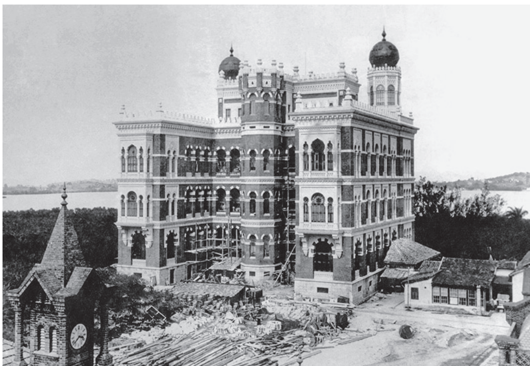
Figura 7: Pavilhão Mourisco em fase de construção, Rio de Janeiro, 1907