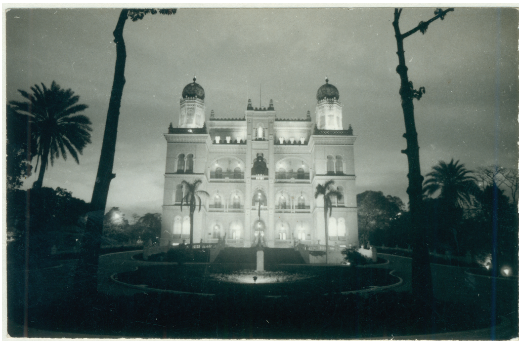
Figura 11: Fachada do Pavilhão Mourisco, vista noturna, Rio de Janeiro, s.d.