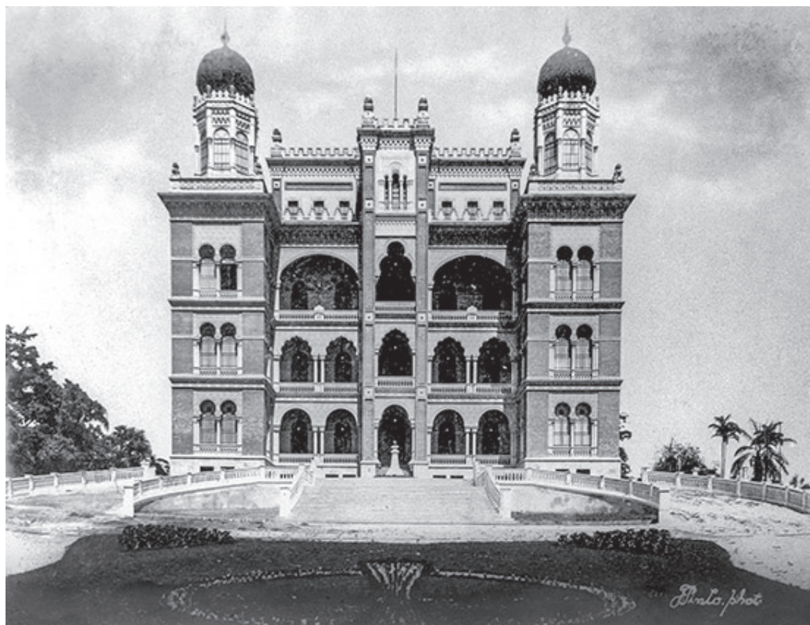
Figura 10: Vista do Pavilhão Mourisco, Rio de Janeiro [1910-1920]