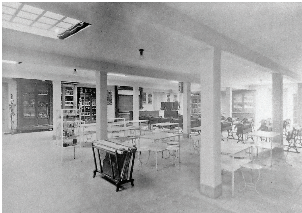
Figura 4: Laboratorio de Historia Natural del Colegio Nacional de Buenos Aires, c.1910-1930 (Colegio Nacional de Buenos Aires, Argentina)

Los cambios en las modalidades pedagógicas, de una enseñanza más descriptiva y comparada hacia una enseñanza más experimental generaron en los gabinetes de los colegios nacionales nuevos espacios de “laboratorio” con mayor presencia de instrumentos y lugar para las mesas de disección y observaciones microscópicas. Por ejemplo, a comienzos del siglo XX el gabinete del Colegio Nacional de Buenos Aires se llamó “Laboratorio de Historia natural” (Figura 4) y un inventario, con registros entre 1903 y 19011, tiene inscripto una importante cantidad y diversidad de instrumentos. Entre ellos, microscopios, balanzas, estufas y mecheros, instrumental de vidrio y porcelana, micrótopo, aparatos de fisiología experimental como el cardiógrafo de Marey, el esfigmógrafo de “Dudgeon”, un miógrafo vertical, elementos adquiridos para la realización de diversos experimentos sensoriales de oído, vista y olfato y otros instrumentos el desarrollo de la histología y la vivisección (Laboratorio..., 1903).