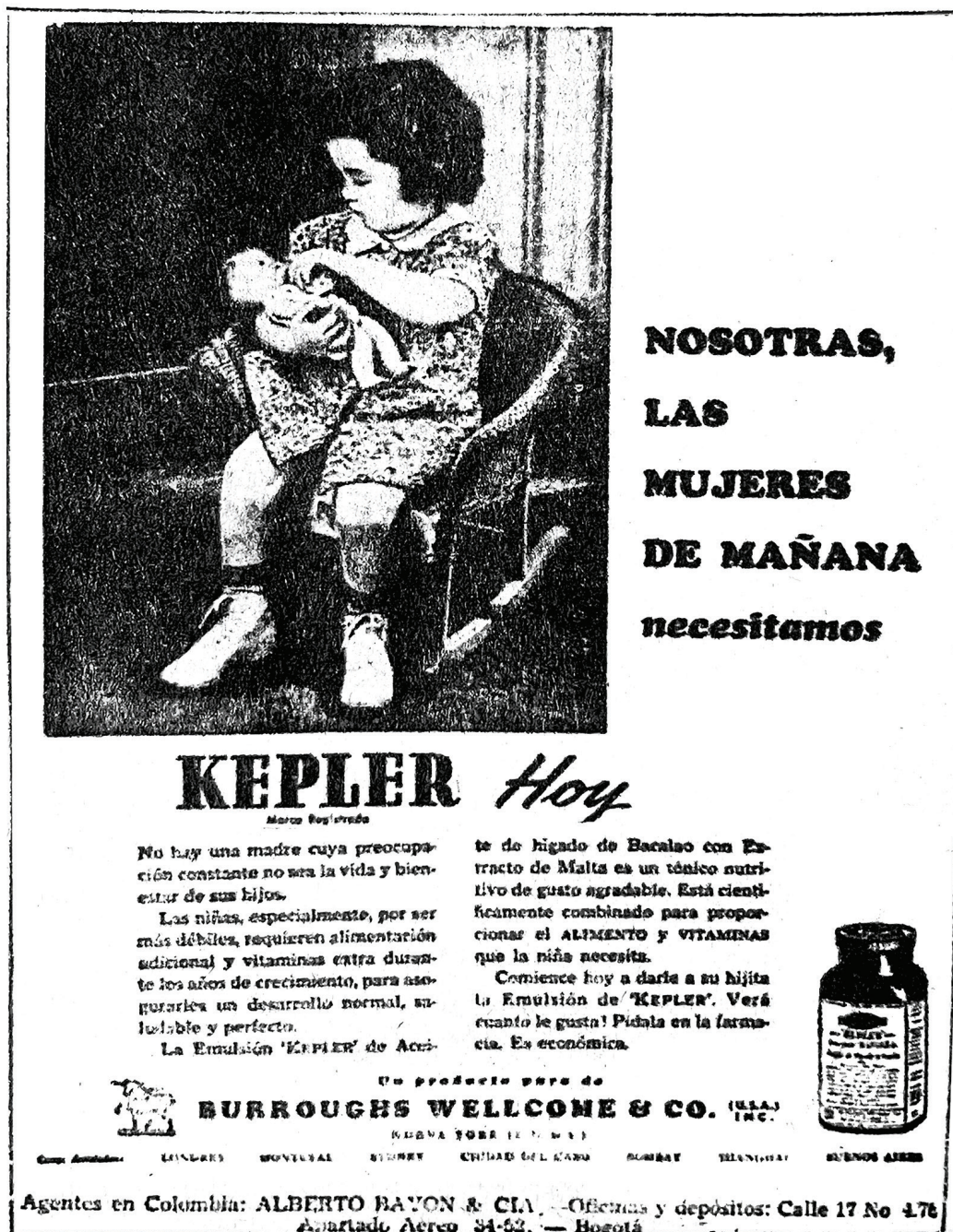
Figura 3: Nosotras, las mujeres de mañana necesitamos Kepler hoy (Nosotras..., 17 nov. 1944, p.7)

Así mismo, los avisos adoptaron la idea de brindar supuestos consejos a las madres sobre el cuidado infantil, de este modo empezaron a construir una serie de adjetivos y calificativos para denominar a las madres, entre los que estaban: “prudentes” (15 años..., 1 jul. 1919, p.3) “previsoras” (Metholatium, 22 ago. 1931, p.7), “cuidadosa” (¿Esta el niño..., 21 jun. 1933, p.9)