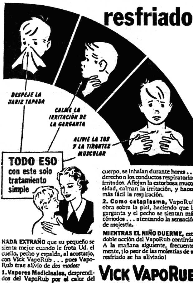
Figura 4: Alivie todos estos tormentos del resfriado (Alivie..., 9 mar. 1945, p.7)