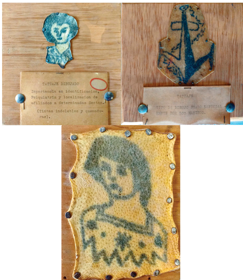
Figura 3: Colección de tatuajes de José María Garavito Baraya tomados de los cadáveres de dos extranjeros (Colección Museológica..., s.f.)

Garavito Baraya era un médico especialista en investigación criminalística y forense, cuya trayectoria profesional fue dedicada al peritaje judicial en la averiguación de hechos criminales a través de estudios toxicológicos, balísticos, radiográficos, valoraciones de lesiones personales y necropsias, donde se encontró varias veces con el tatuaje. La piel tatuada, su histología, su elaboración y su relación con determinadas manifestaciones biológicas fue estudiada por Garavito en los cuerpos de individuos asesinados violentamente cuyos cadáveres no reclamados reposaban en el Instituto de Medicina Legal y al Laboratorio de Criminalística de la Universidad Nacional. Procurando consérvalos para sus clases de medicina forense y para estudios posteriores, Garavito extrajo de los cadáveres algunos trozos de piel tatuada con un procedimiento de curtido para preservar la piel tatuada recién arrancada del cuerpo, cuidando gran parte de la naturalidad de la piel y colores del tatuaje, y que fue montando en tablas pulidas y protegidas con plástico. Una práctica al parecer común entre algunos médicos, ya que, por ejemplo, Mario Robledo Villegas contaba con su propia colección para el estudio de lesiones cutáneas (Garavito Baraya, 1966; Correa Henao, 1965).