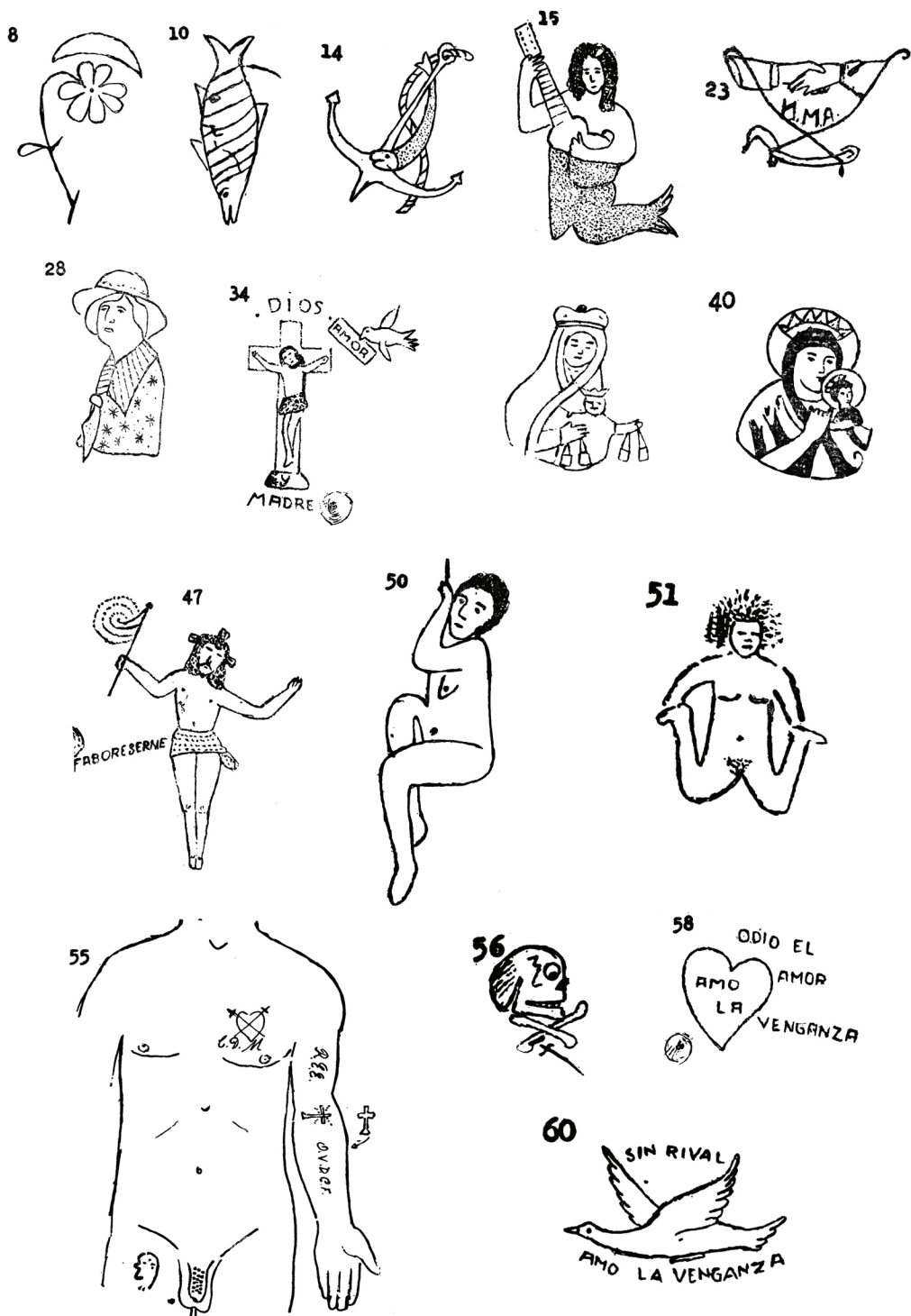
Figura 4: Colección de tatuajes de Alfredo Correa Henao (1965)