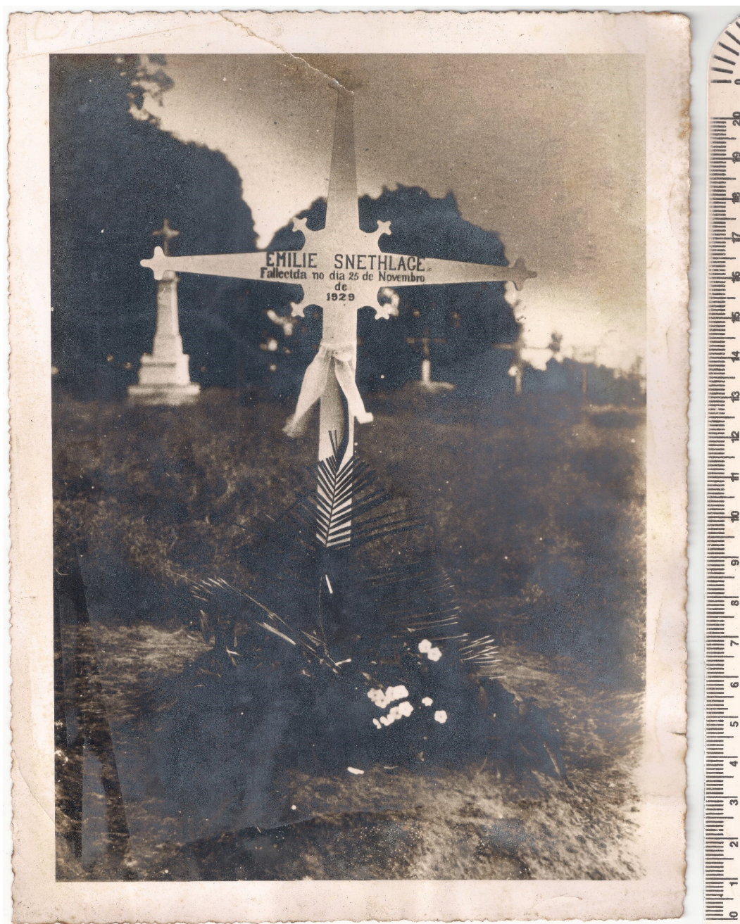
Figura 3: Local de sepultamento de Emília Snethlage, data desconhecida