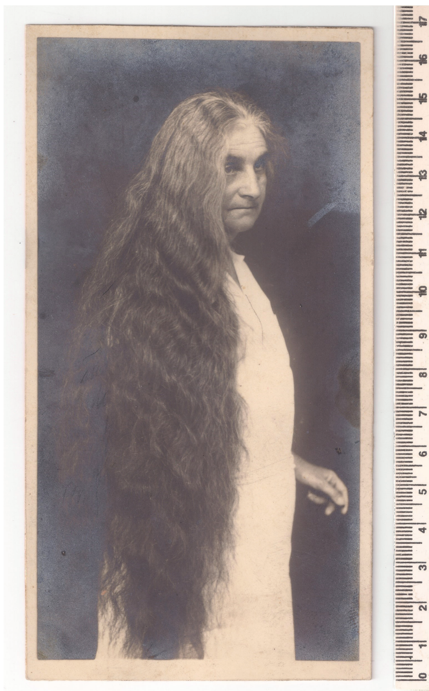
Figura 4: Única foto conhecida de Emília Snethlage com cabelo solto, provavelmente década de 1920