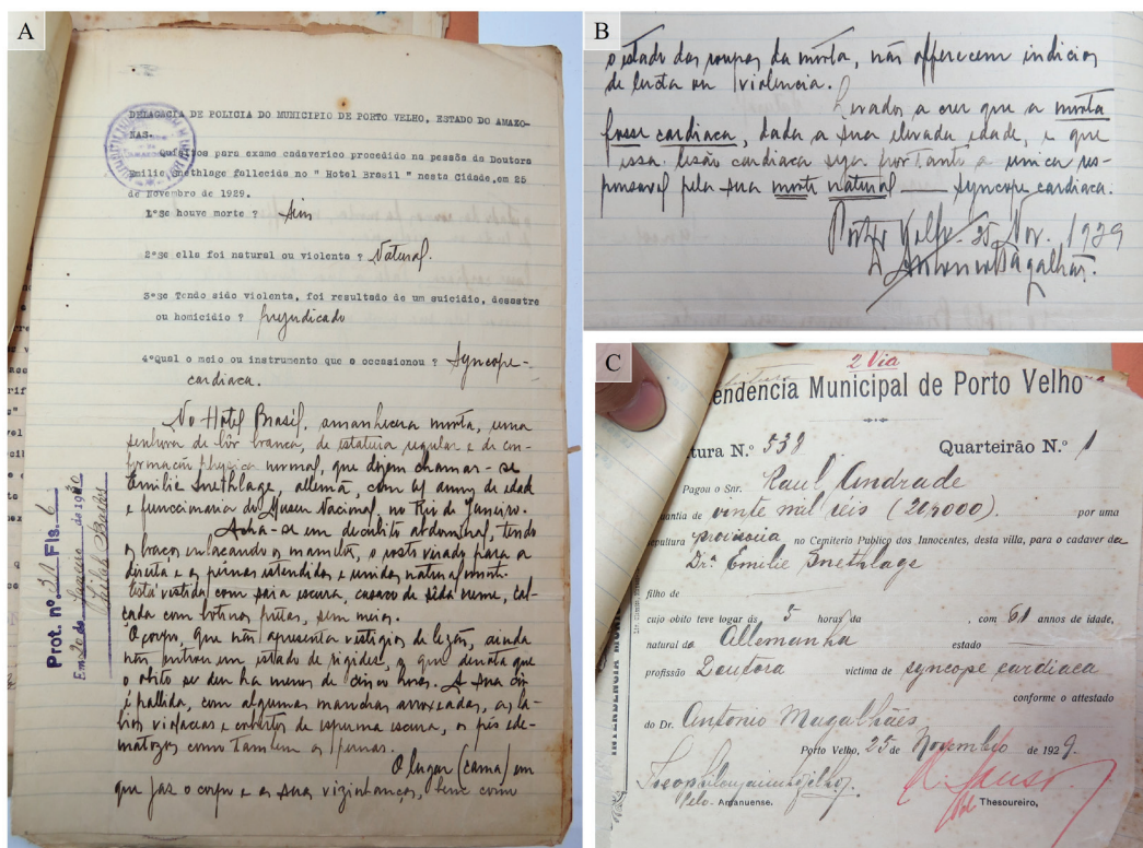
Figura 2: Atestado de óbito (A e B) e local provisório de sepultamento (C) de Emilia Snethlage