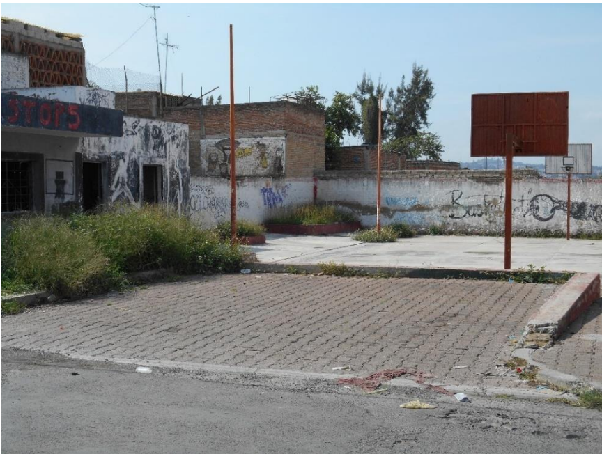
Figura 3. Pista de baloncesto en la Colonia Loma Bonita