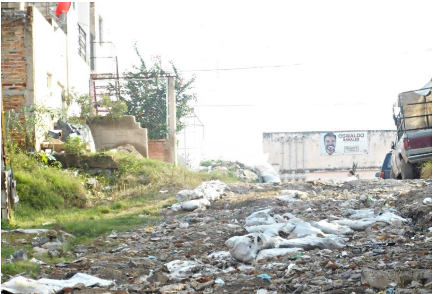
Figura 2. Cartel electoral dominando una calle de Zalatitis