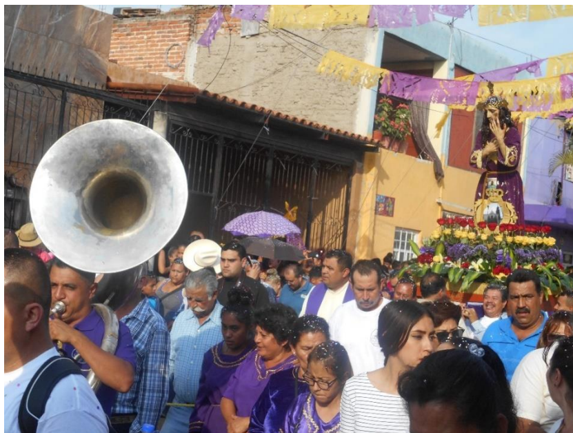
Figura 4. Procesión del Señor del Buen Temporal