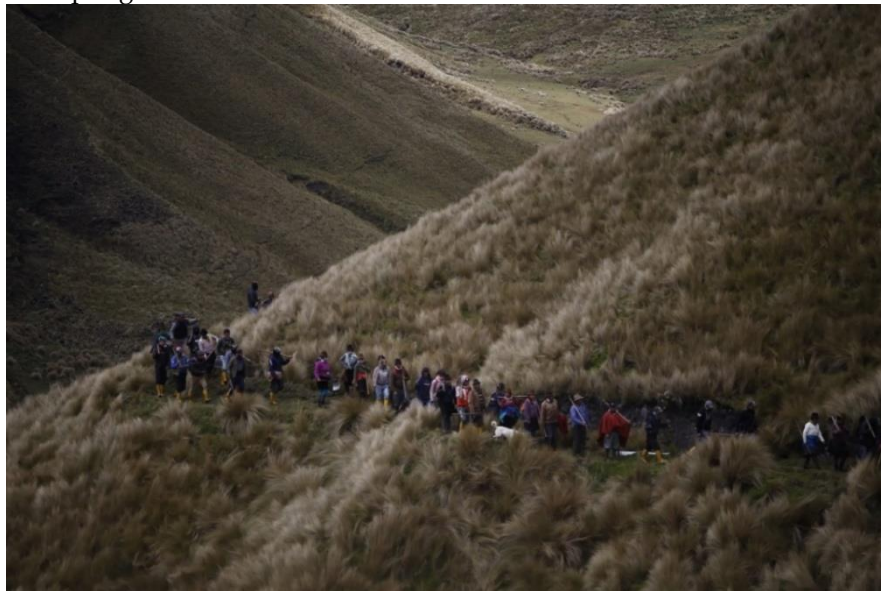
Imagen 2. Minga comunitaria de la Asociación de trabajadores de Rumipungo