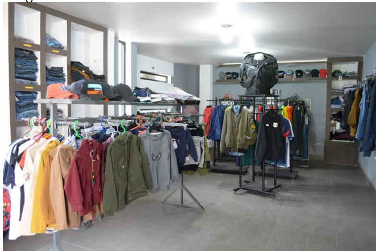
Imagen 6. La tienda de William Guascha