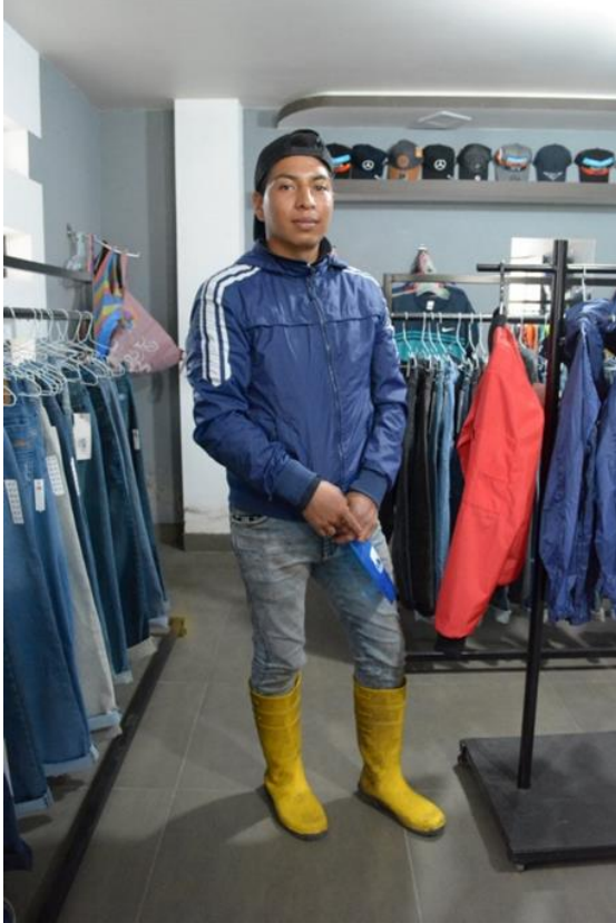
Imagen 5. Comerciante, ganadero y agricultor

Fuente: Foto tomada por Andrés Felipe Ortiz, Yacubamba 2022