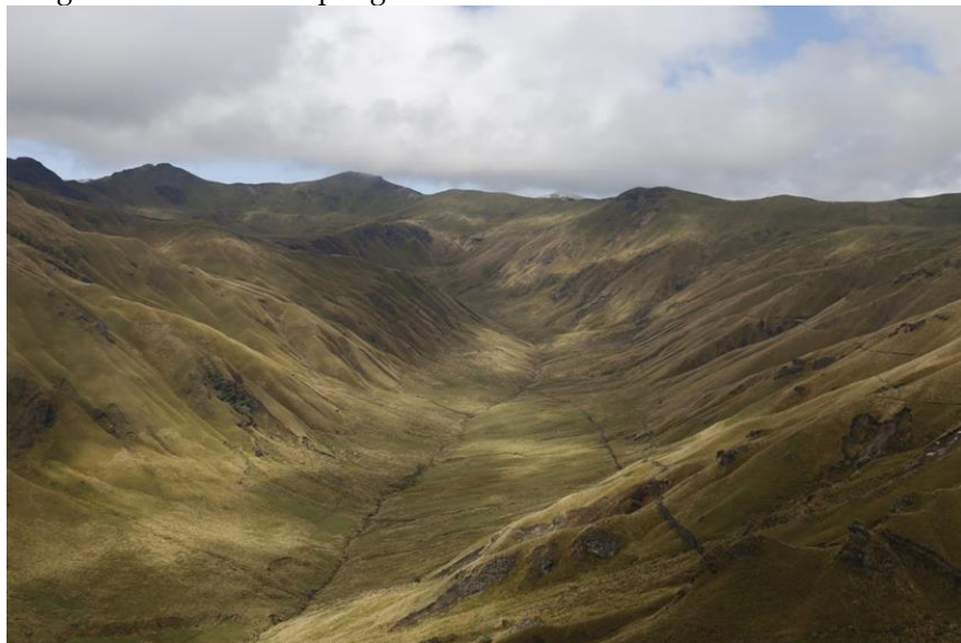
Imagen 1. Páramo Rumipungo Toro Rumi