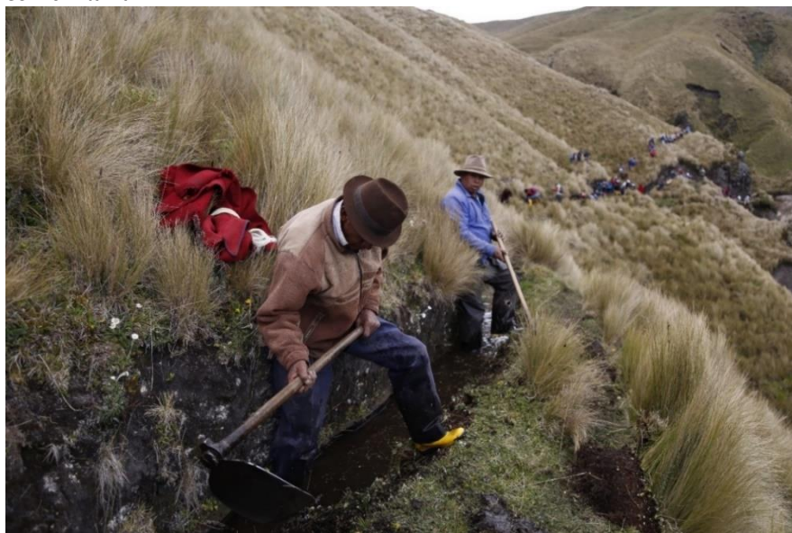
Imagen 3. Comuneros limpiando los canales de agua en la minga comunitaria