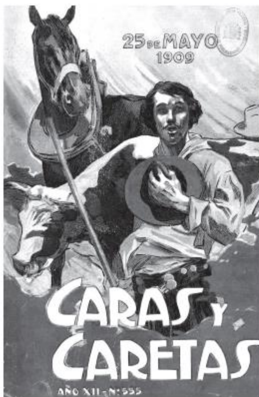
Figura 4. Caras y Caretas , n° 555.