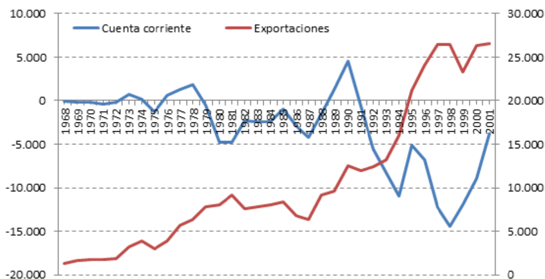
GRÁFICO 1: EXPORTACIONES Y CUENTA CORRIENTE. 1968 – 2001. MILLONES DE U$D.