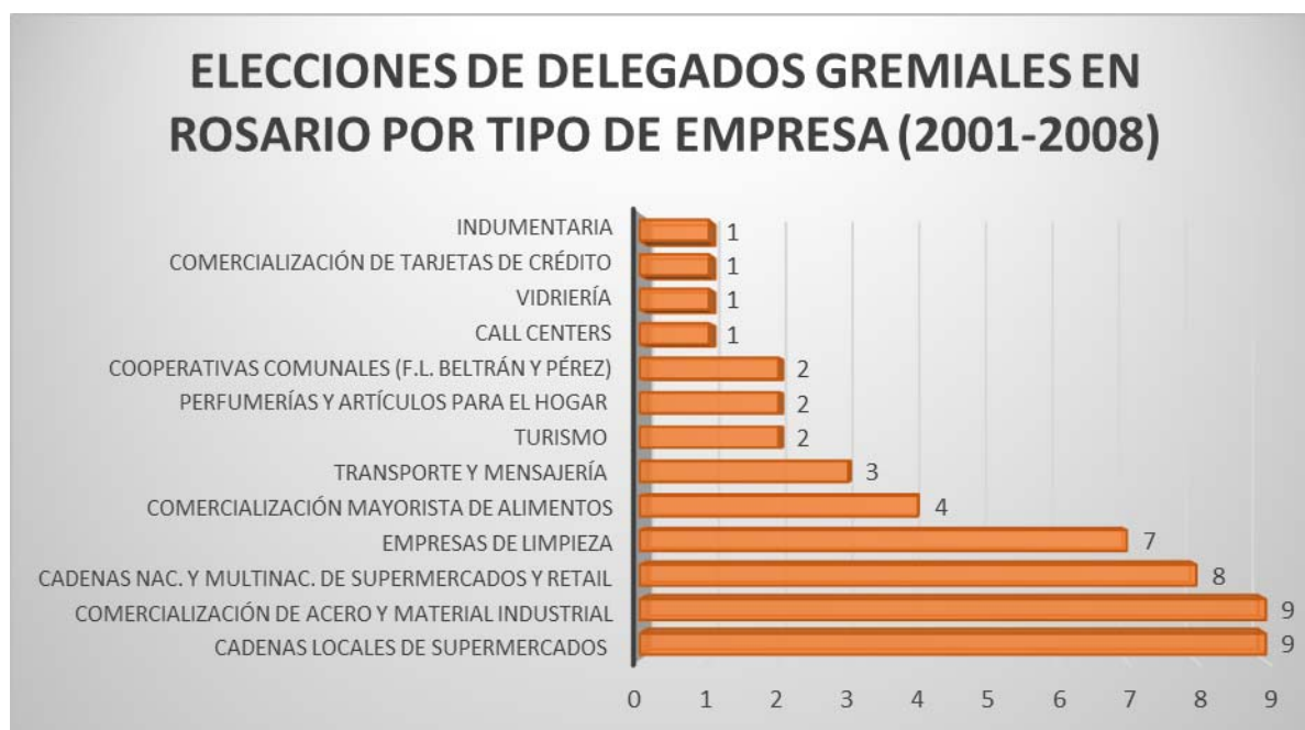
Cuadro N° 1. Elecciones de delegados gremiales en Rosario por Tipo de Empresa (2001-2008)

Fuente: Elaboración propia en base a la Memoria y Balance de A.E.C. 2001-2008.