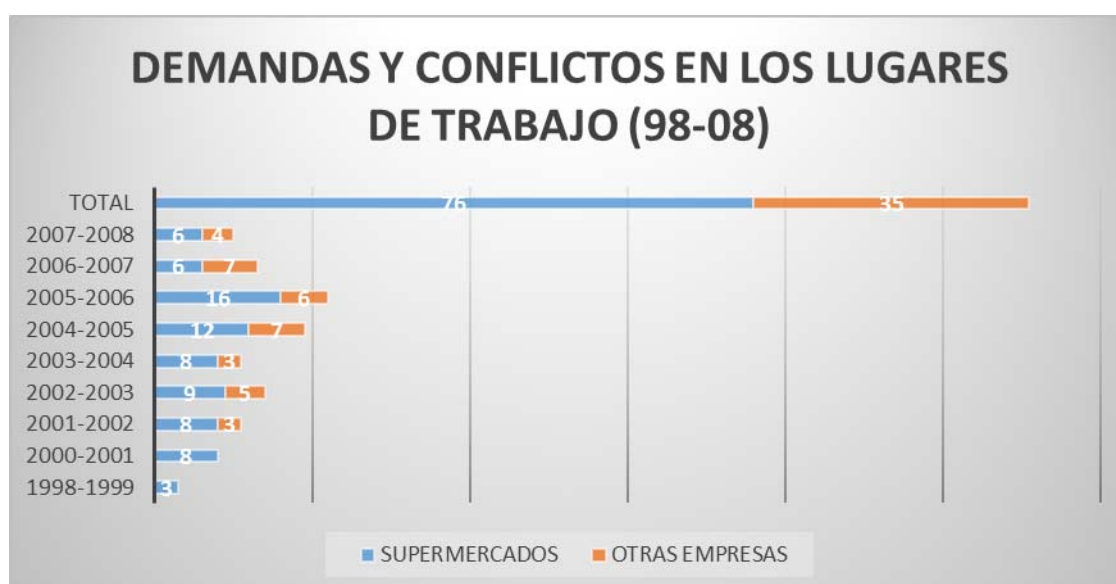
Cuadro N° 2. Denuncias y conflictos según tipo de empresa (1998-2008)

Fuente: Elaboración propia en base a la Memoria y Balance de A.E.C. 1998-2008.