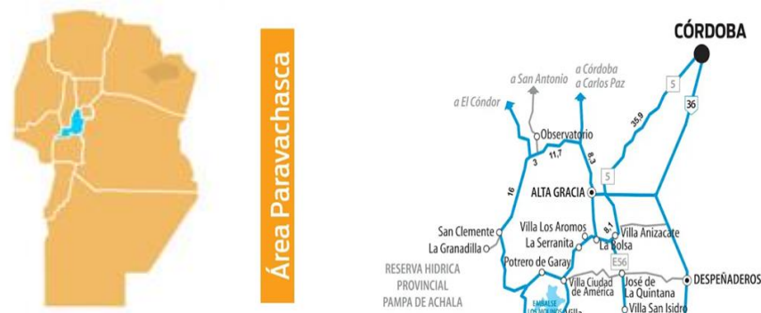
Figura 1. Geolocalización del Valle de Paravachasca (Córdoba, Argentina)