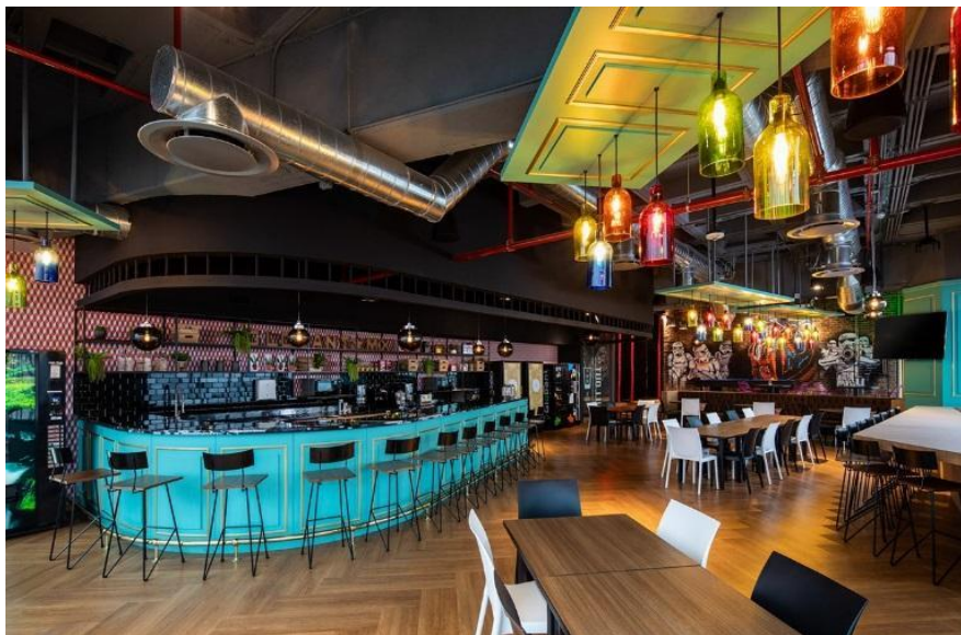
Bar “Globar”, Globant México.

oficinas de trabajo incorporando el tiempo de ocio a los tiempos de trabajo, es decir, institucionalizando el ocio. Y en segundo lugar, incorporan a esos momentos de ocio en el trabajo la utilización de dispositivos electrónicos y tecnológicos, como por ejemplo, las últimas versiones de consolas de videojuegos o plataformas corporativas gamificadas 9 .