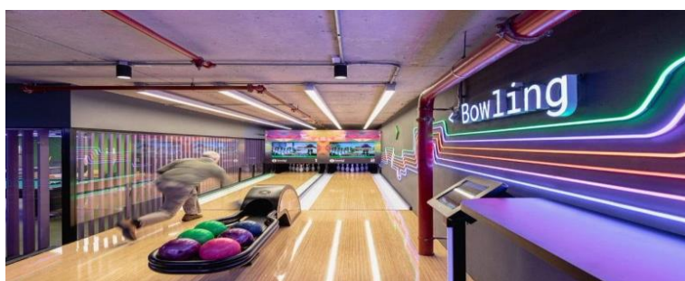
Sala de bolos, Globant Uruguay.

¿Quién imaginaría jugar una partida de bolos en la oficina mientras toma un descanso de su jornada laboral? ¿Tomar un trago en el bar de la empresa, almorzar jugando videojuegos o ver una película en una sala de cine contigua a la oficina de trabajo? Todos esos imaginarios, que parecieran no tener conexión alguna con los mundos del trabajo, tienen un margen de posibilidad en las lúdicas oficinas de la empresa Globant. Tal como lo expresa Guibert Englebienne, uno de los socios fundadores de Globant, el trabajo asociado a la diversión es un declarado valor corporativo. Dichos valores, representativos de la filosofía empresarial imperante en Globant, son seis y componen el “manifiesto de talento Globant”: actuar éticamente, pensar en grande, innovar constantemente, apuntar a la excelencia, ser un jugador de equipo y divertirse trabajando. Una suerte de guía del buen glober que definen un modo de concepción y de ejecución del trabajo vinculado a la creatividad e innovación permanente: un modo de ser en el trabajo (Krepki, 2019).