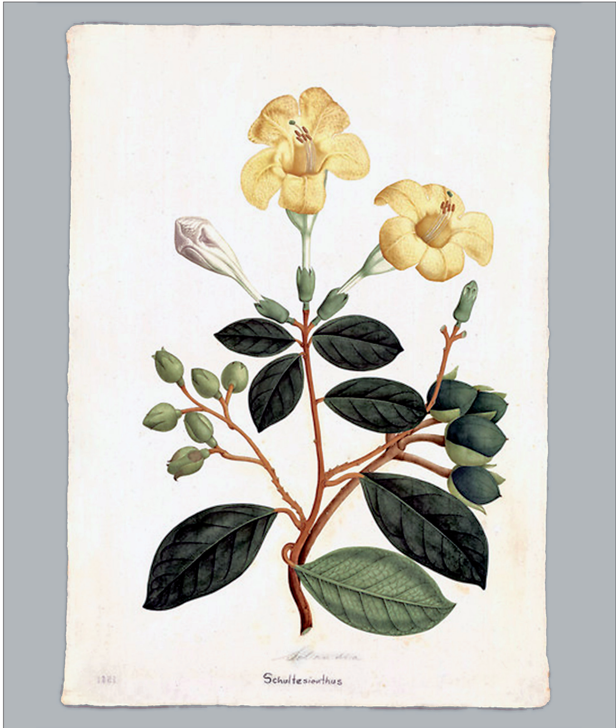
Figura 5. Solandra. Dibujos de la Real Expedición Botánica del Virreinato de Nueva Granada (1783-1816). Signatura: DIV. III A-1541.