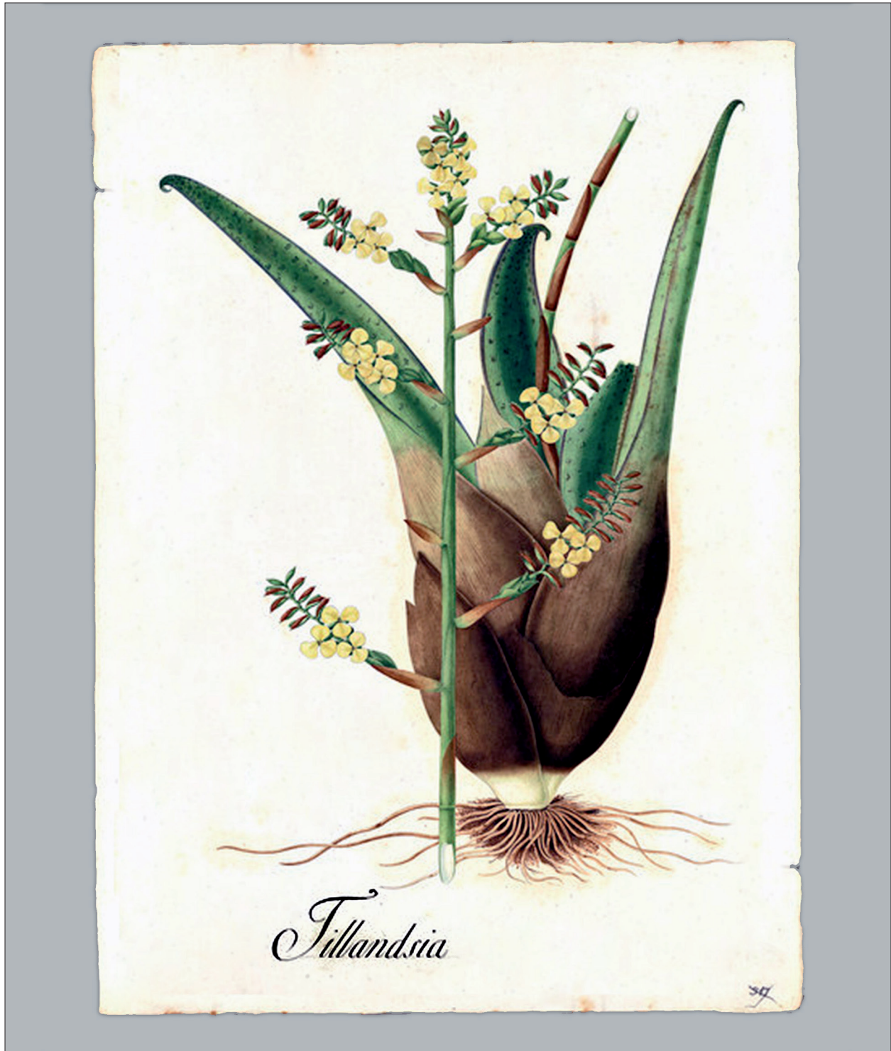
Figura 3. Tillandsia. Dibujos de la Real Expedición Botánica del Virreinato de Nueva Granada (1783-1816). Signatura: DIV. III A-307.