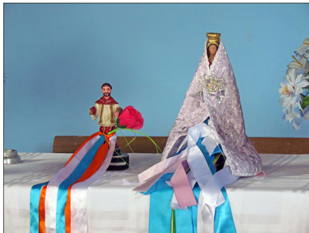
Figura 1. Imagens de São Raimundo e de Nossa Senhora da Batalha, na igreja da comunidade de Pau Furado, durante a 'caminhada do santo' realizada em 2013.