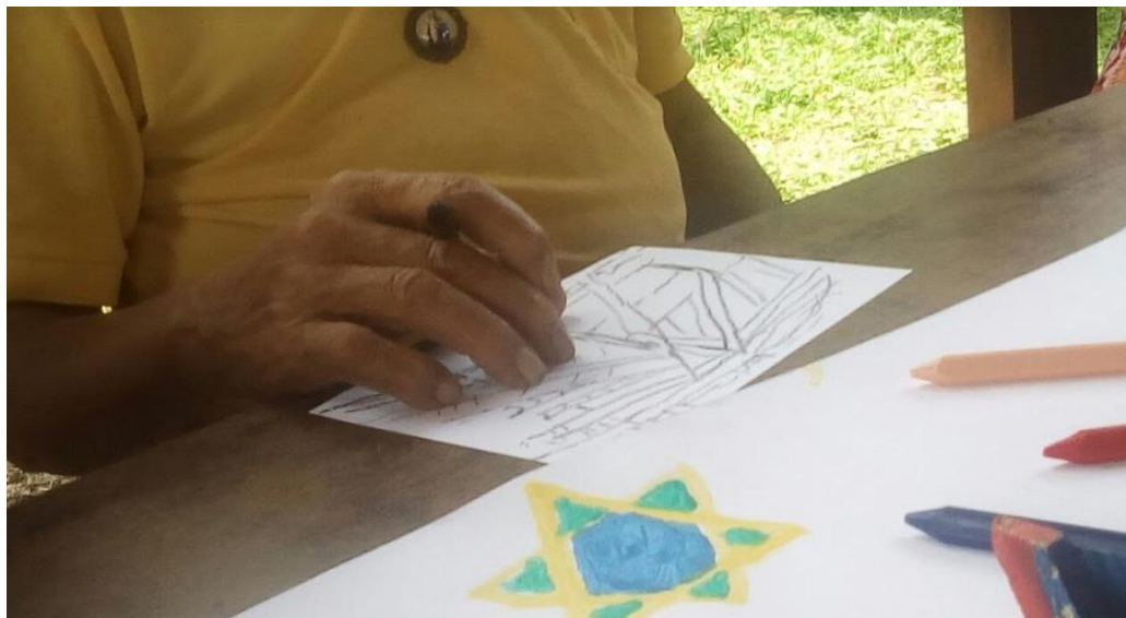
Figura 2: Diseño de la Maloca