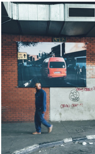
Figura 4. Série Bree Taxi Rank, 2019.