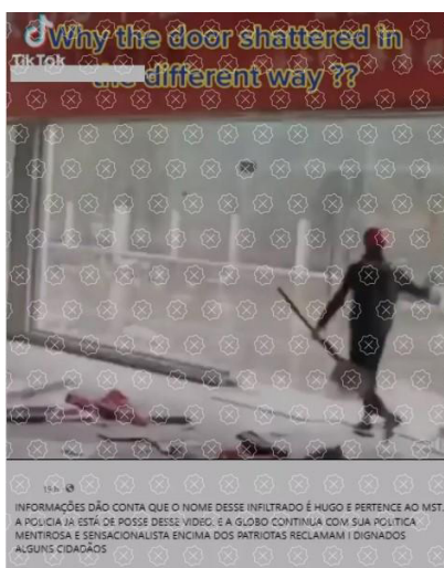
Figura 2. Print Screen do post checado por Aos Fatos, na aferição intitulada “É falso que vídeo mostra integrante do MST ‘infiltrado’ quebrando vidraças em Brasília”.

Ao longo das unidades, algumas pessoas e instituições aparecem como elementos de oposição das narrativas fraudulentas. Algumas delas são: Alexandre de Moraes, Lula, Partido dos Trabalhadores (PT), esquerda, Polícia Federal, TV Globo, Forças Armadas, black blocs , comunismo, Supremo Tribunal Federal (STF), Movimento Sem Terra (MST), que é atrelado a duas informações falsas, explorando a posição cristalizada de uma parte da população que enxerga os integrantes do MST como baderneiros e, portanto, capazes de realizar a depredação.